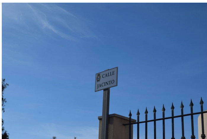
Placa Calle Jacinto