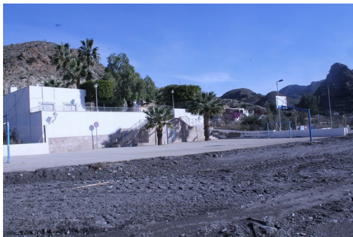
Saltador Bajo 5