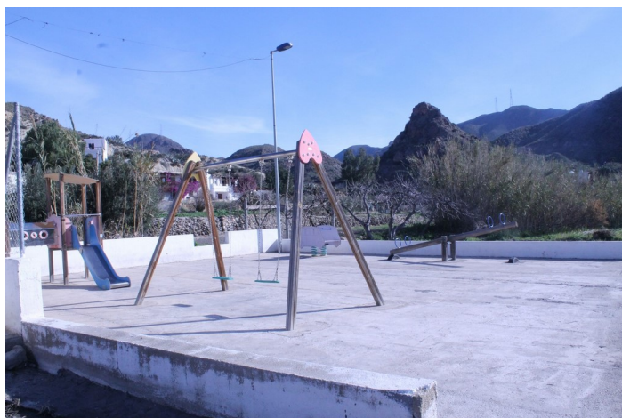
Saltador Bajo 3 Epígrafe 1. Inmuebles