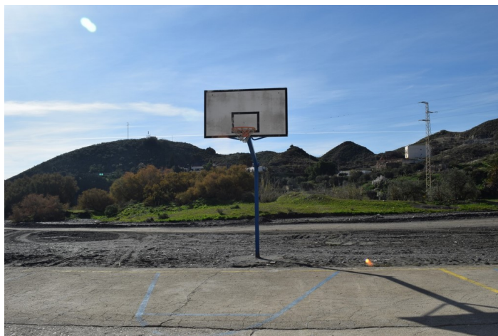
Saltador Bajo 7