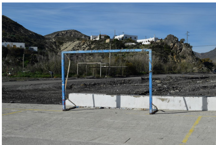
Saltador Bajo 6