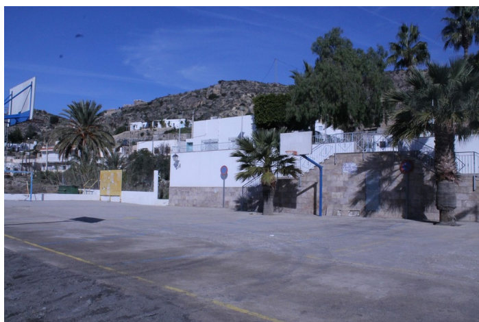
Saltador Bajo 2