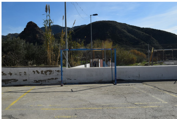
Saltador Bajo 8