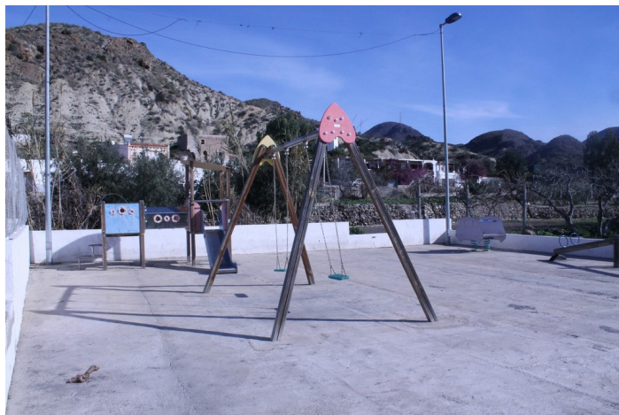
Saltador Bajo 1