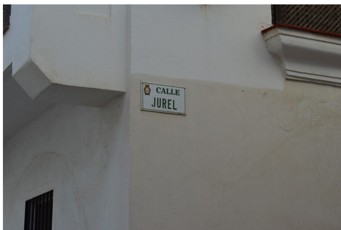
Placa Calle Jurel