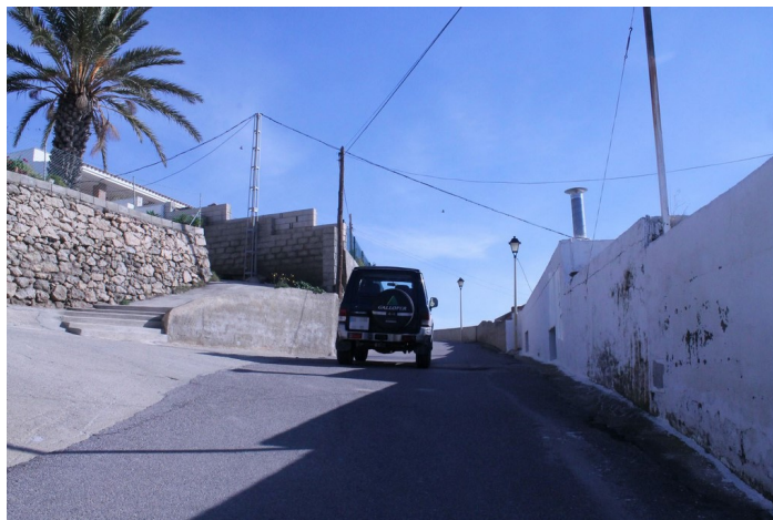
Calle Atarjea hacia arriba