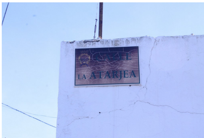
Placa Calle Atarjea Epígrafe 1. Inmuebles