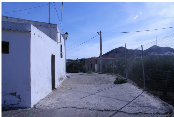
Calle Atarjea hacia abajo