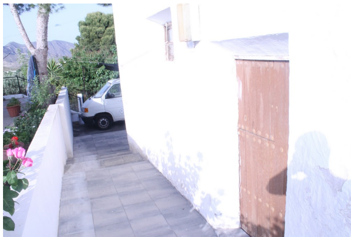
Puerta de acceso a la Ermita de El Llano de Don Antonio