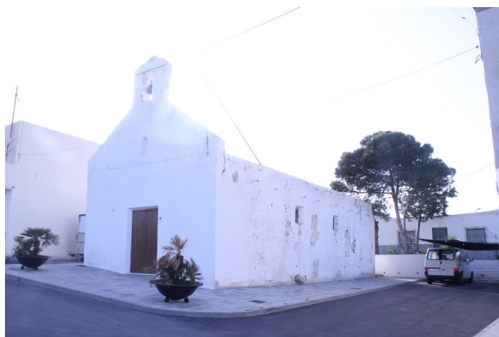
Ermita de El Llano de Don Antonio desde la derecha