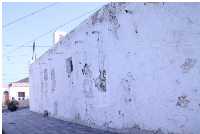
Detalle patológico del muro de la Ermita de El Llano de Don Antonio