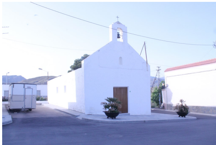
Ermita de El Llano de Don Antonio desde la izquierda