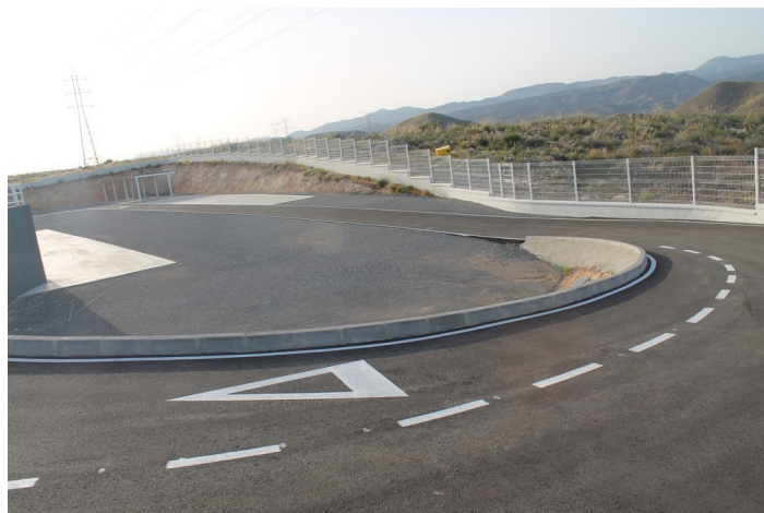
Interior del Punto Limpio de Carboneras