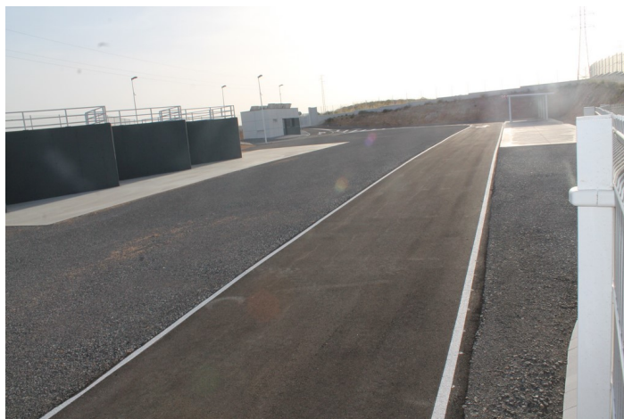
Interior del Punto Limpio de Carboneras