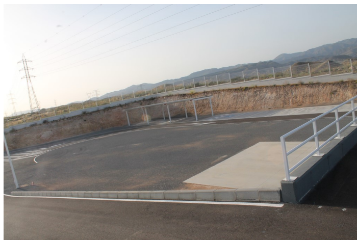
Interior del Punto Limpio de Carboneras