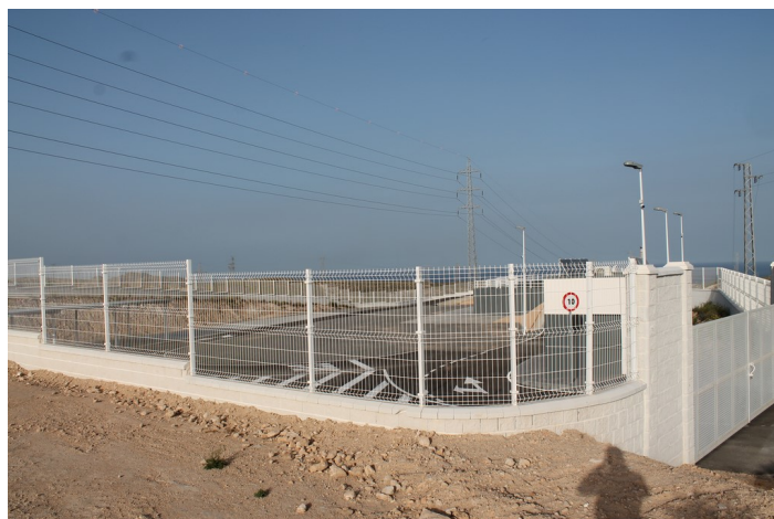
Punto Limpio de Carboneras