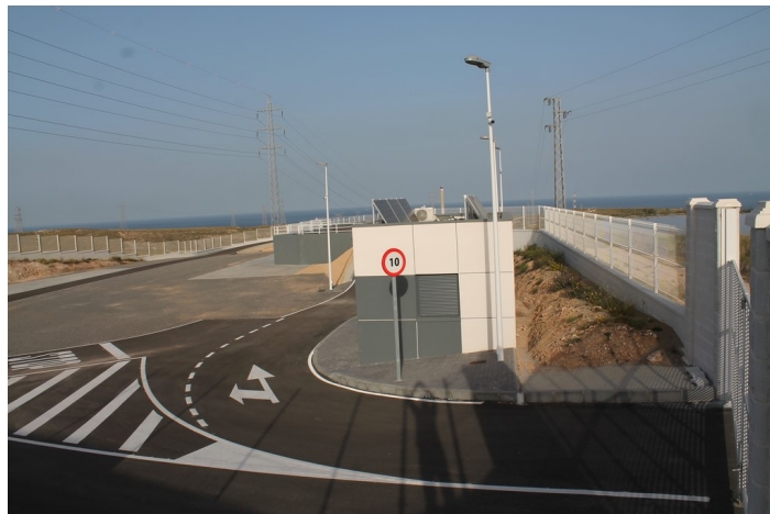
Punto de recepción del Punto Limpio de Carboneras