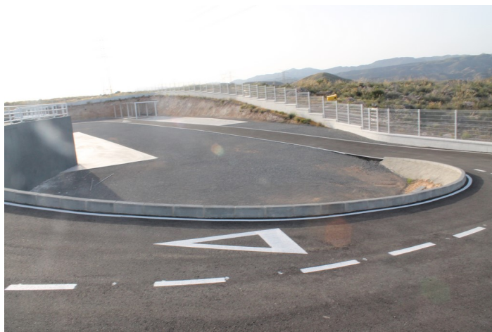
Interior del Punto Limpio de Carboneras