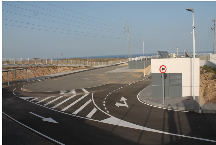
Punto Limpio de Carboneras por dentro