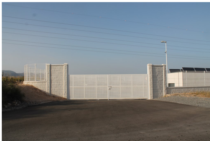
Puerta de acceso al Punto Limpio de Carboneras