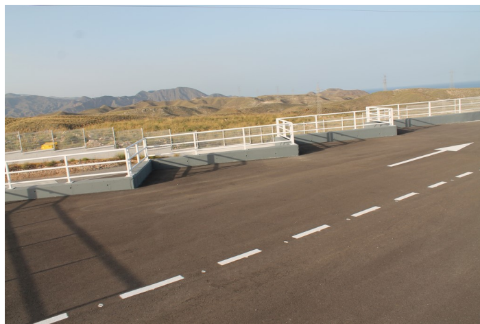
Interior del Punto Limpio de Carboneras