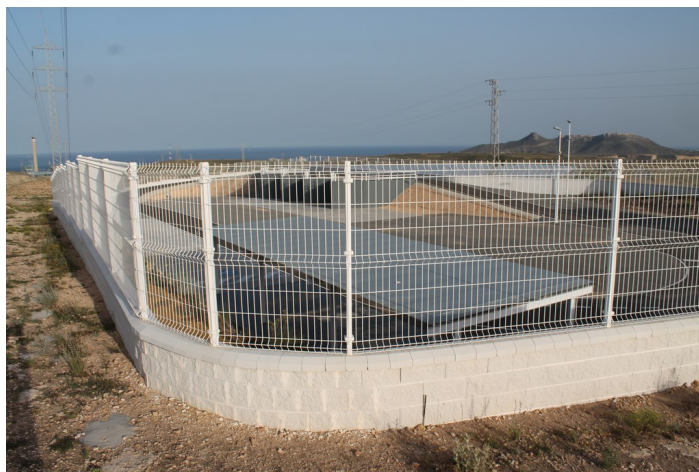
Exterior del Punto Limpio de Carboneras