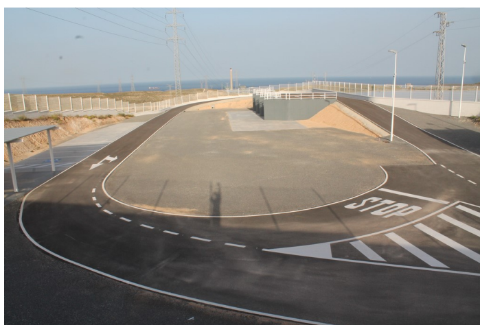
Interior del Punto Limpio de Carboneras