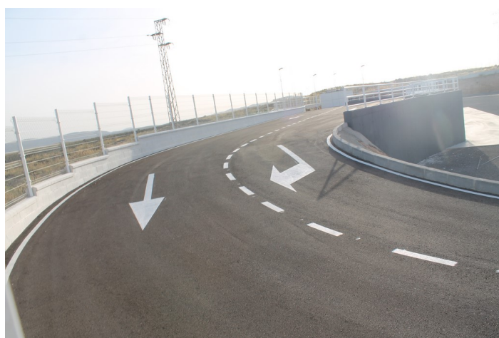
Interior del Punto Limpio de Carboneras