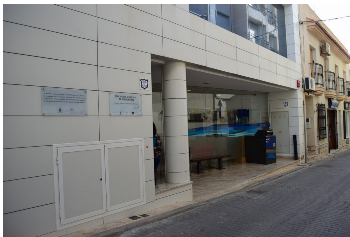
Fachada Biblioteca Municipal