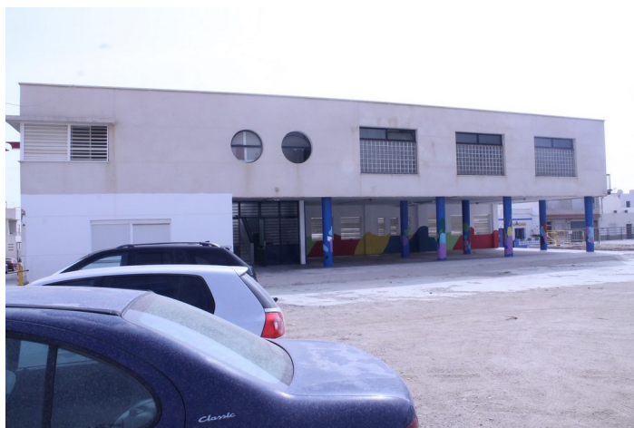
Fachada del Antiguo Simón Fuentes