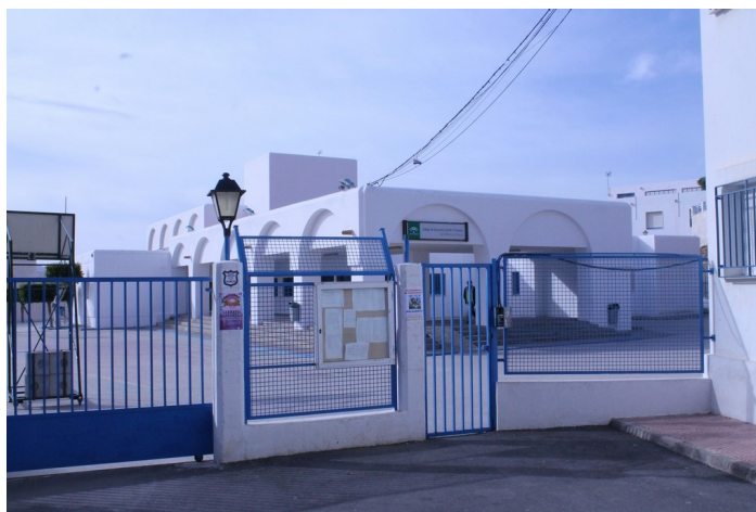
Edificio del C.P. San Antonio