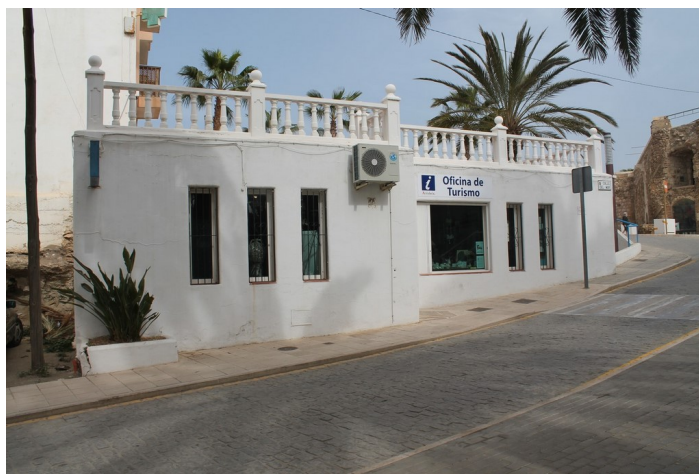
Fachada Oficina de Turismo