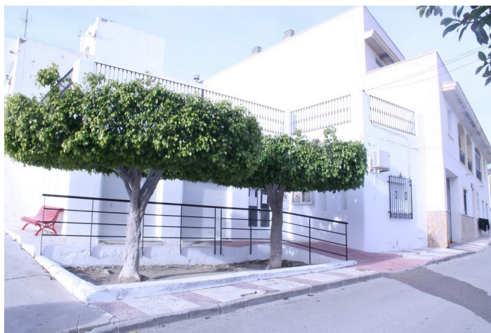
Fachada C.S. Llano de Don Antonio