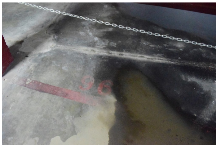
Plaza de Garaje G-96