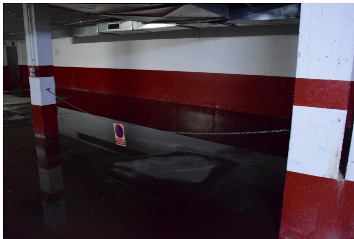
Plaza de Garaje G-97