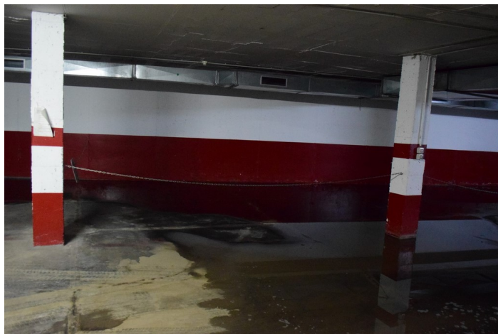
Plaza de Garaje G-101