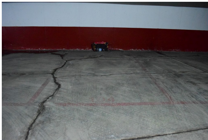
Plaza de Garaje G-104