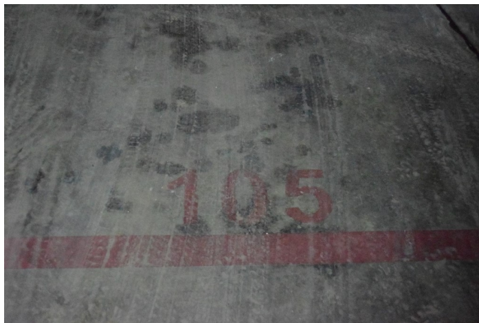
Plaza de Garaje G-105