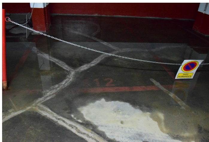
Plaza de Garaje G-112