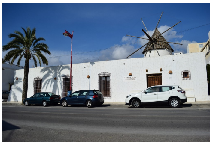
Fachada Centro de Interpretación de los Molinos