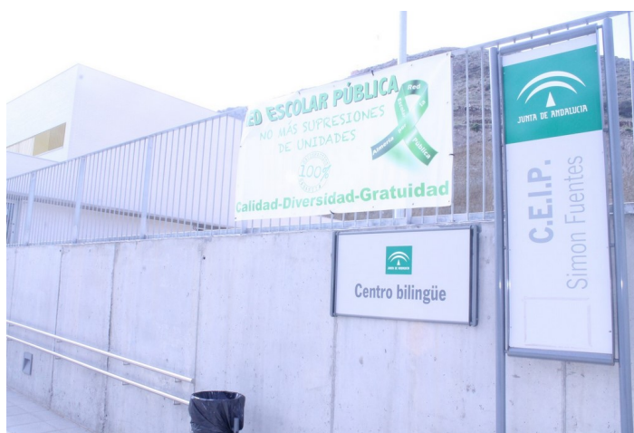
Placa C.P. Simón Fuentes