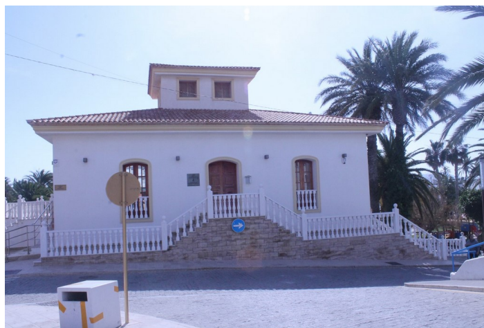
Fachada Casa de las Tejas desde Plaza Castillo