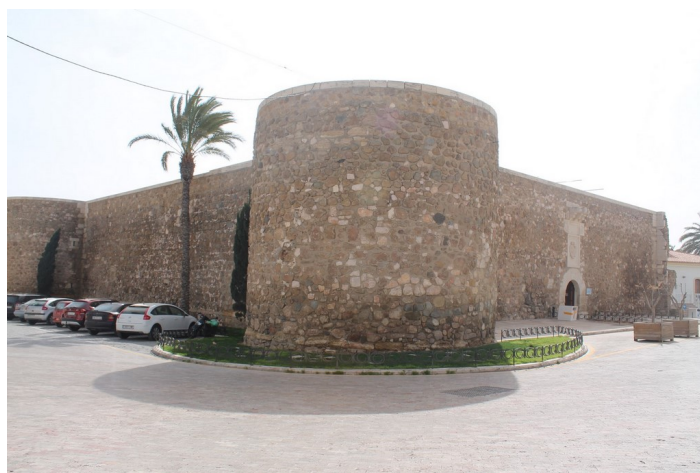
Fachada Castillo San Andrés desde Calle Nueva