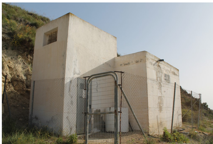
Depósito de Agua de Gafares