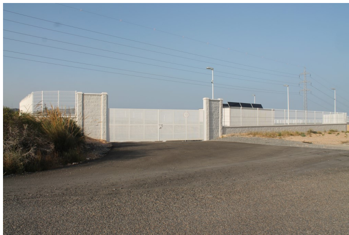
Punto Limpio de Carboneras