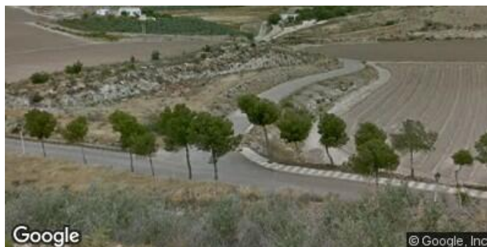
Acceso a camino desde Cementerio