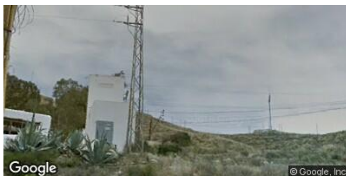
Acceso a camino desde Glorieta