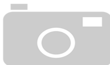
IMAGEN NO DISPONIBLE

Destino Funcional: Circulación de vehículos y/o personas