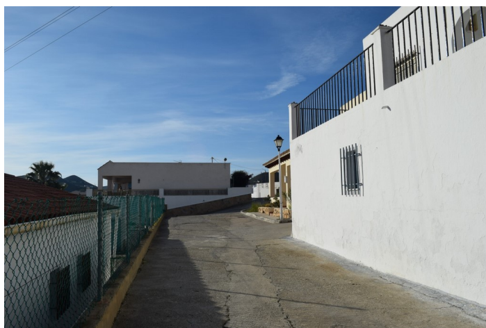
Calle Santa Catalina hacia Poniente