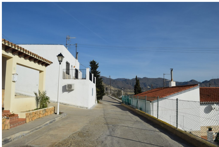
Calle Santa Catalina hacia Levante