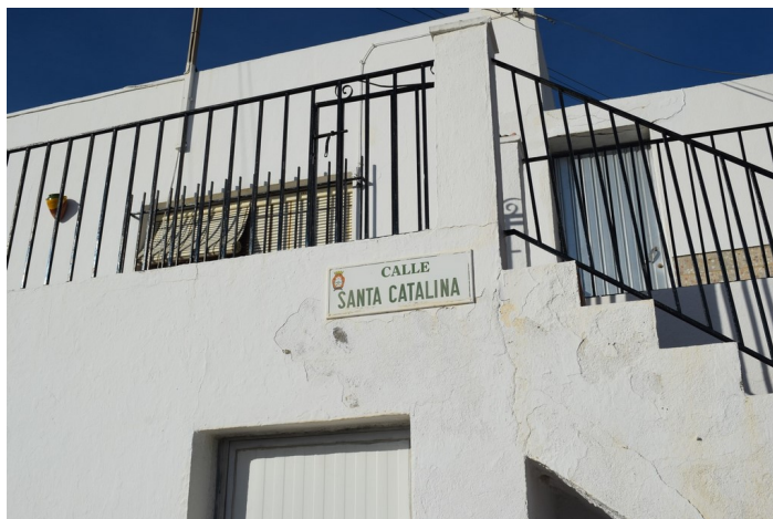
Placa Calle Santa Catalina