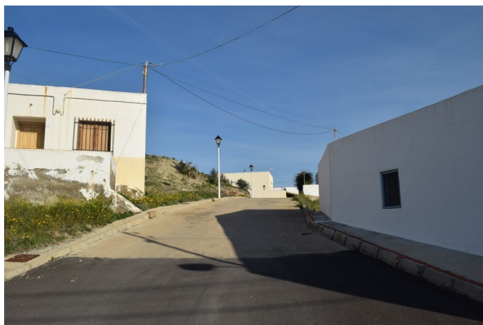
Calle Santa Catalina hacia arriba Epígrafe 1. Inmuebles