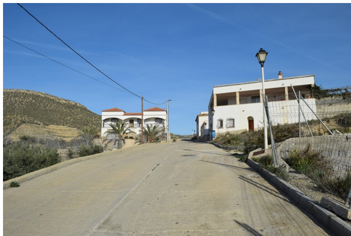
Calle del Depósito