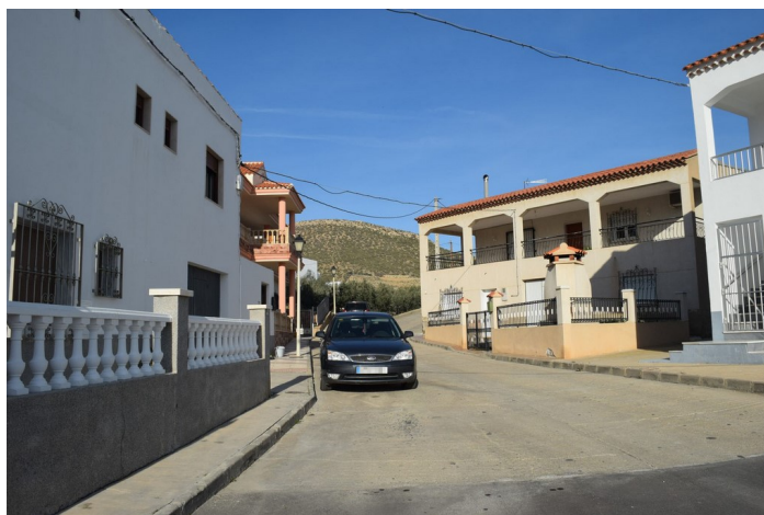
Calle del Depósito Epígrafe 1. Inmuebles