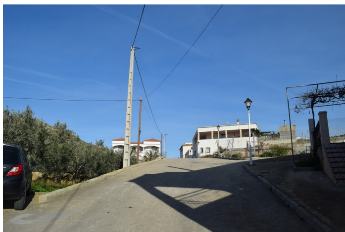
Calle del Depósito