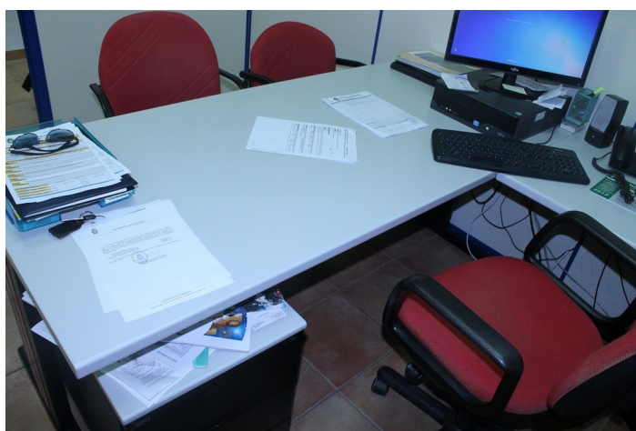
Despacho recogida denuncia