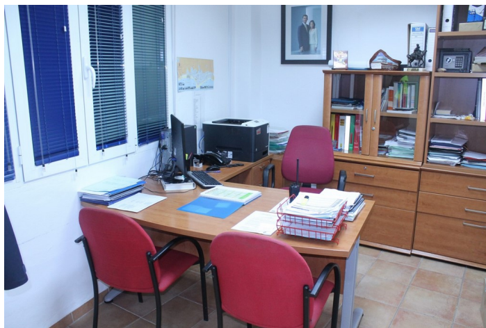
Despacho Jefe policia