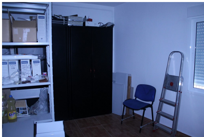
Archivo y armario