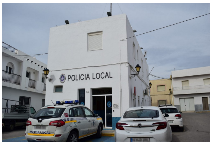
Fachada de Edificio de Policía Local