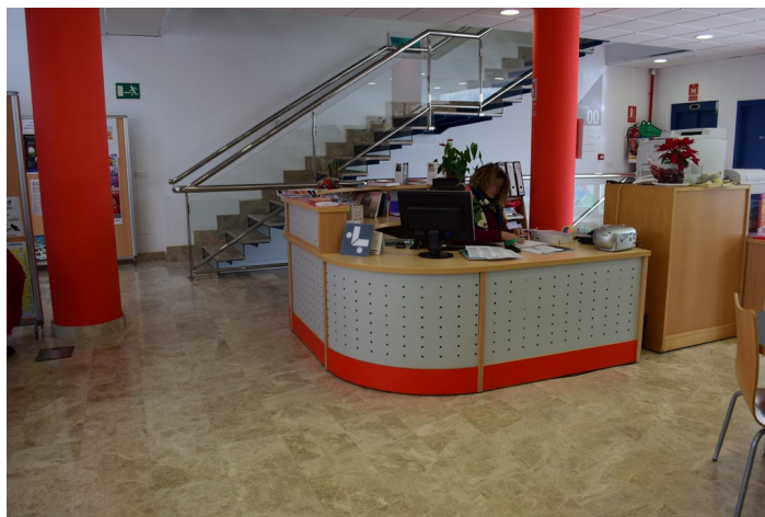
Punto de información