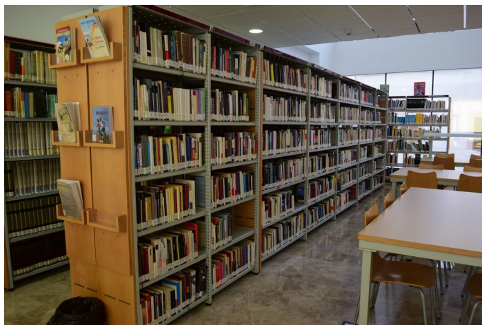
Sala de lectura