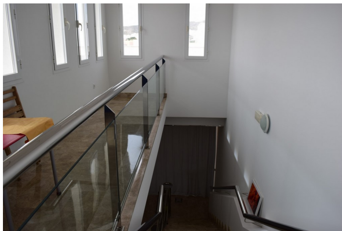
Acceso cocina privada personal