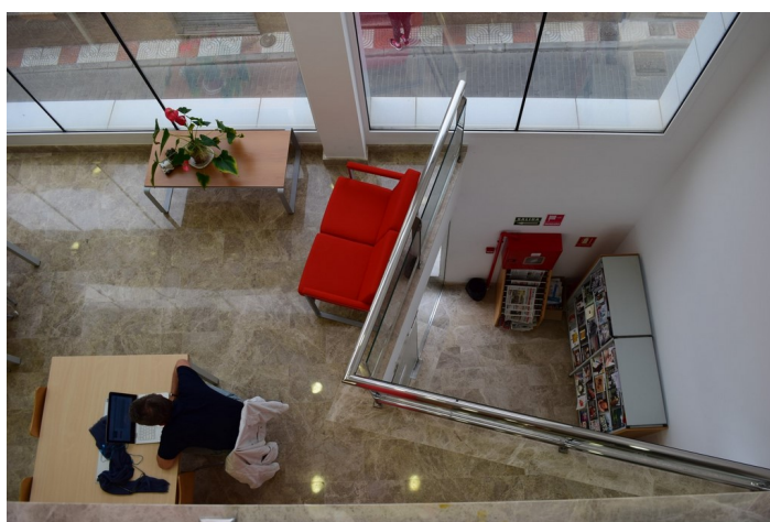
Vista planta baja y planta primera