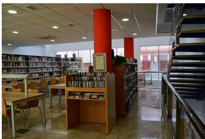
Sala de lectura