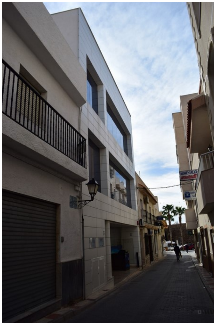
Fachada desde la izquierda