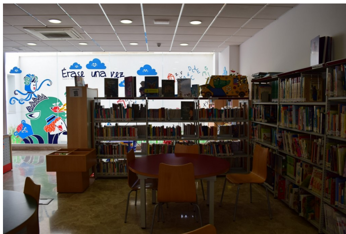
Sala de lectura