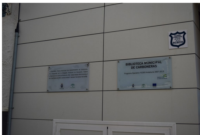
Placas de Inauguración de la Biblioteca Municipal