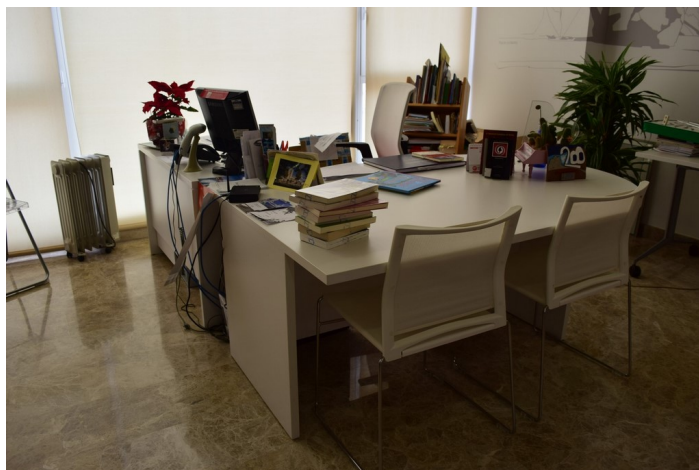
Recepción sala de lectura