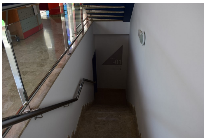
Escalera de bajada al archivo y mantenimiento