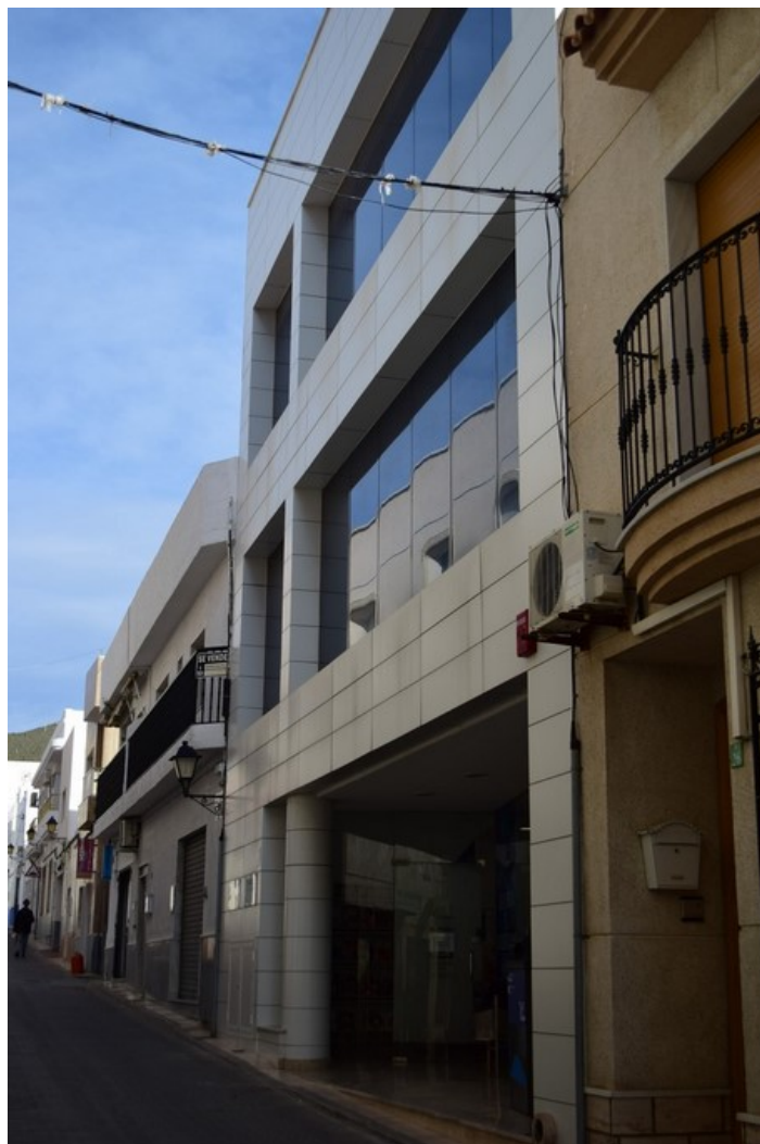
Fachada desde la derecha de la Biblioteca