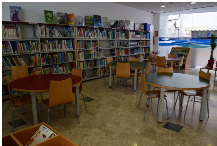
Sala de lectura