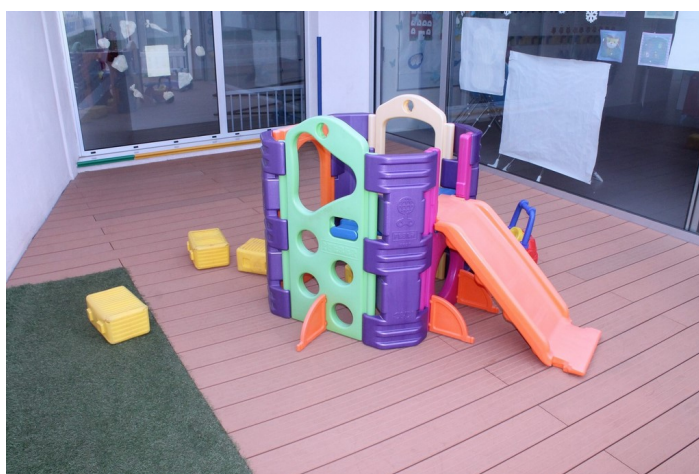
Zona juego en el exterior