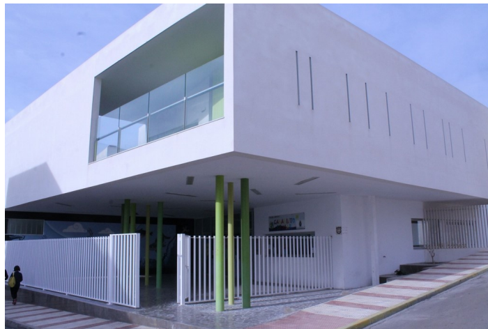
Fachada Guarder a Caballito de Mar