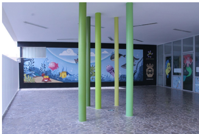
Acceso a la guarder a