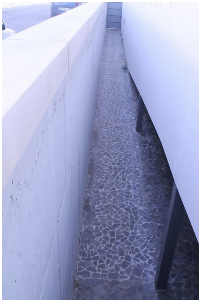
Detalle separaci3n del edificio