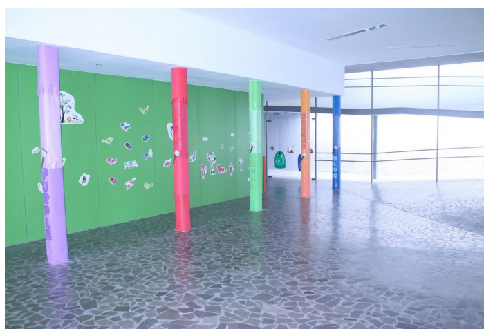
Entrada de la Guarder3a Caballito de Mar