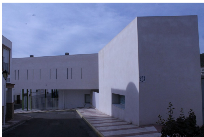
Fachada Guarder a Caballito de Mar Calle Joaqu n