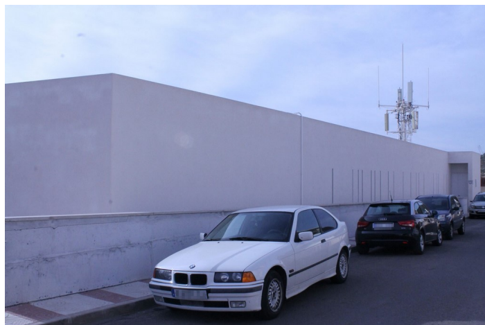
Fachada Guarder a Caballito de Mar Calle La Horma