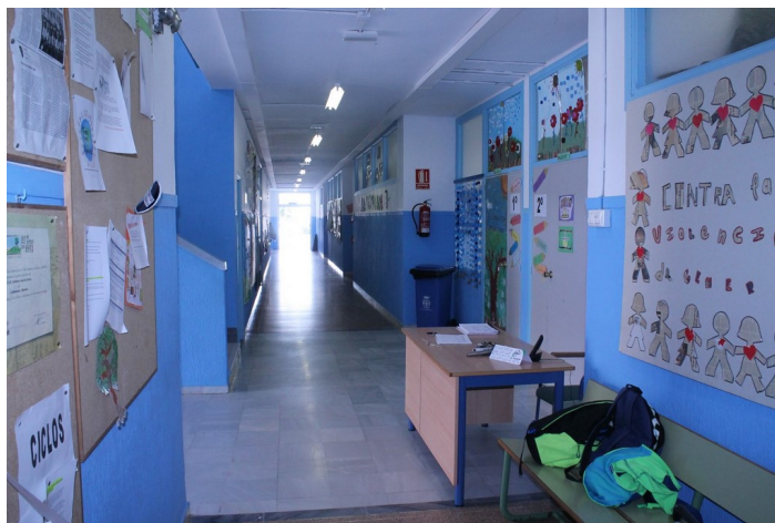
Pasillo del edificio de primaria