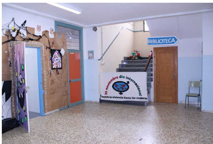
Entrada a aulas de infantil