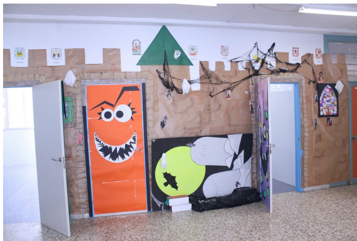
Vestíbulo edificio de infantil