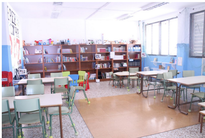
Aula de primaria