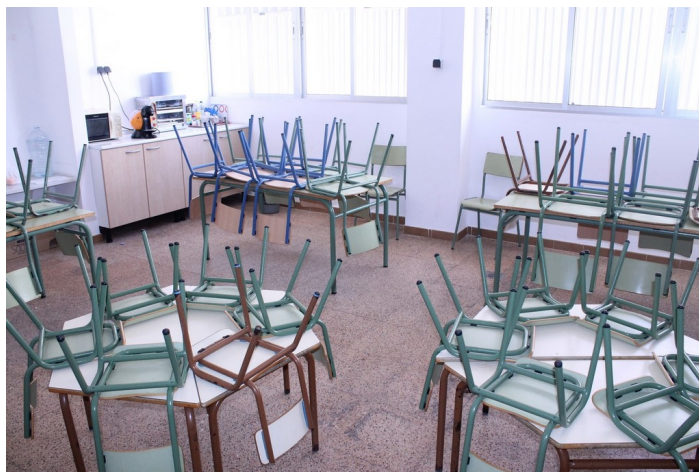
Aula de infantil