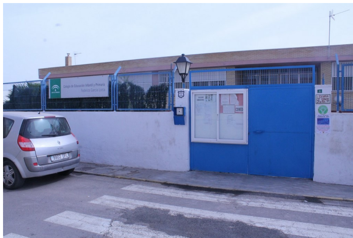
Entrada C.P. Federico Garc a Lorca