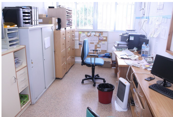
Oficina del edificio de primaria