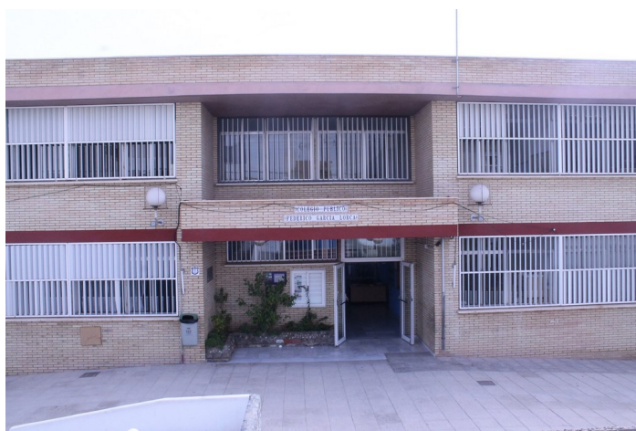
Entrada al edificio de primaria