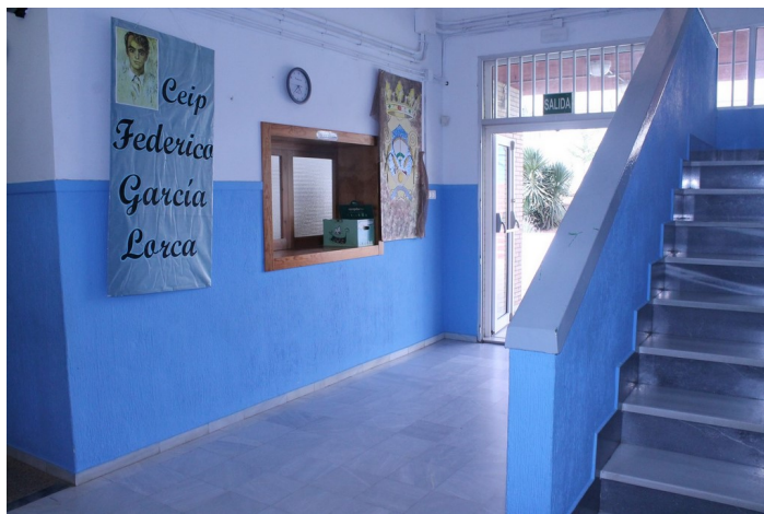
Acceso al edificio de primaria