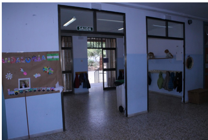
Acceso del edificio de infantil