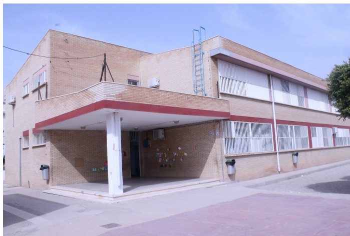
Salida al patio del edificio de primaria