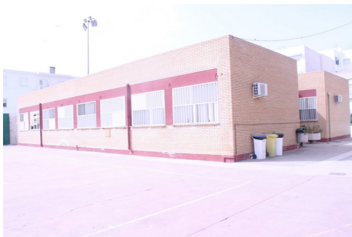
Edificio de infantil desde el patio