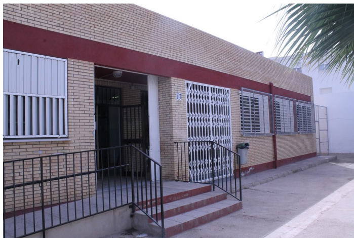
Entrada edificio de infantil