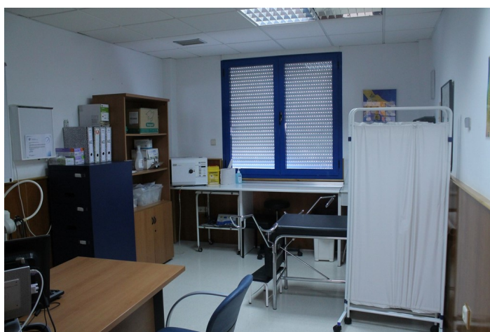
Consulta C.S. El Lometico