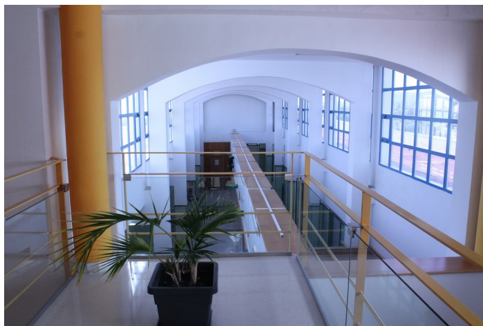
Planta segunda C.S. El Lometico