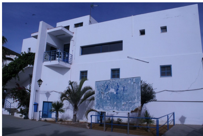
Fachada trasera C.S. El Lometico