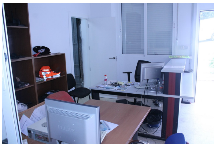
Oficina de Protección Civil