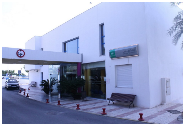
Fachada delante C.S. El Lometico