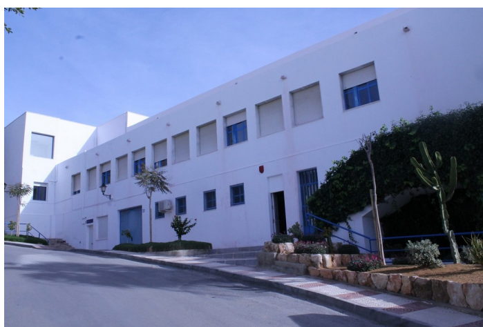
C.S. El Lometico desde Avda. 28 Febrero