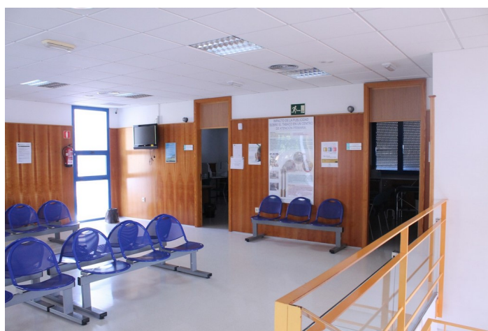
Sala de espera y consultas