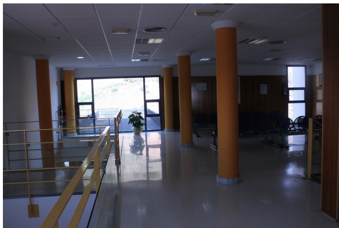
Sala de espera planta segunda