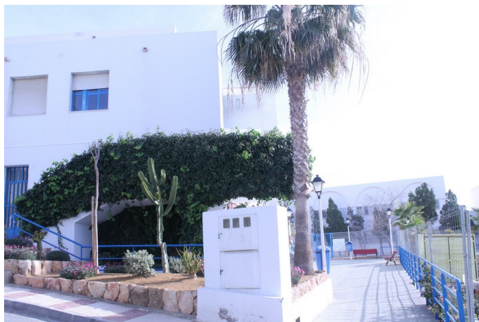
C.S. El Lometico desde la plaza