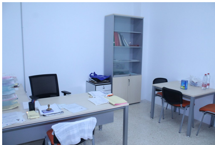
Oficina de Protección Civil