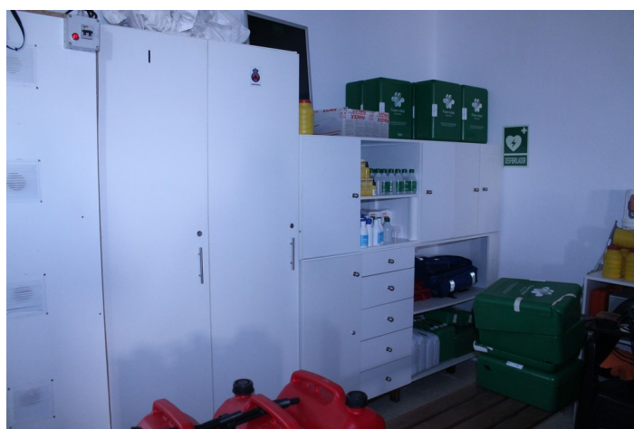
Equipamiento de protección civil