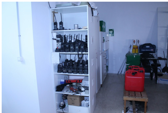
Equipamiento de protección civil