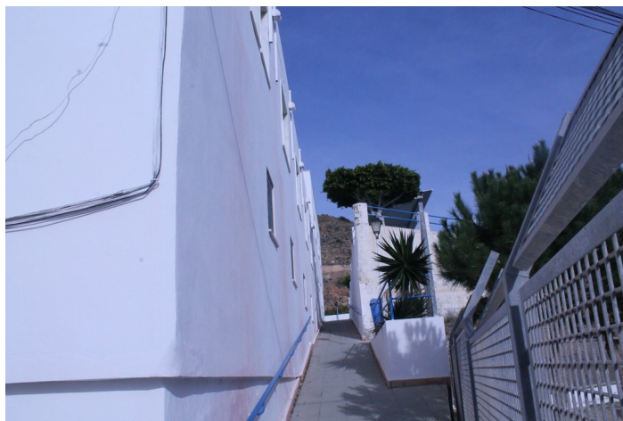
Bajada a plaza C.S. El Lometico