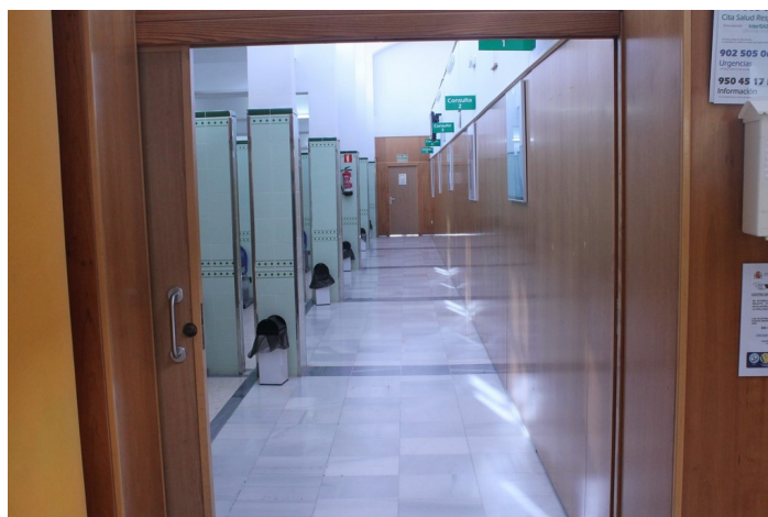
Entrada a salas de espera