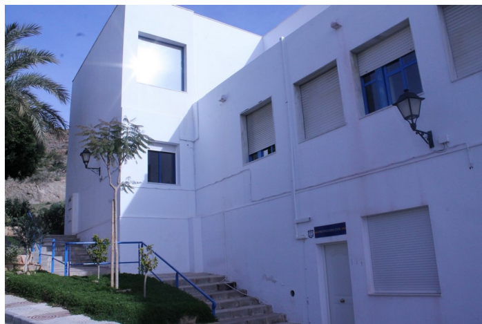
Entrada a Protección Civil