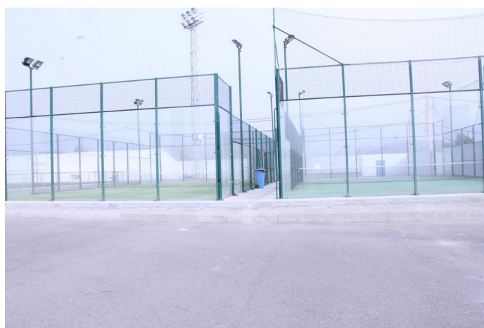
Puerta de acceso C.D.M. Las Marinicas