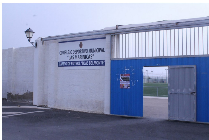
Puerta de acceso C.D.M. Las Marinicas