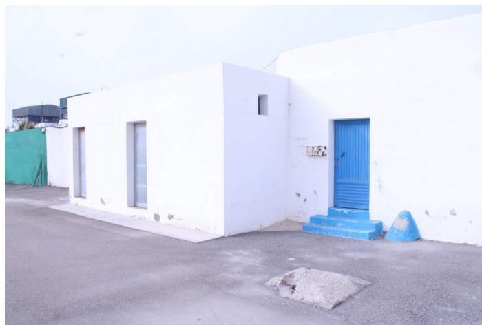
Almacén C.D.M. Las Marinicas