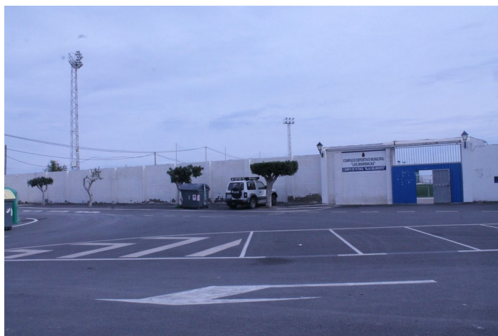
C.D.M. Las Marinicas desde los aparcamientos