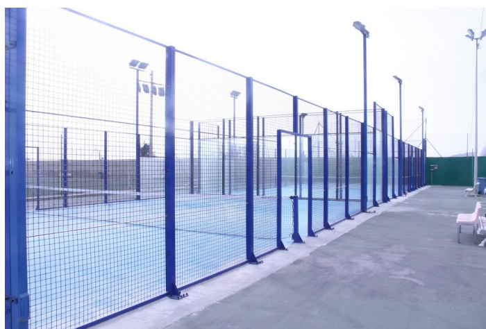
Pistas de pádel