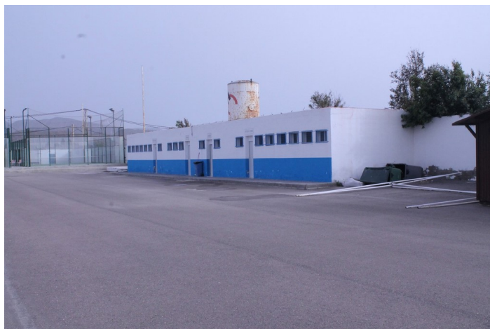
Edificio de vestuarios