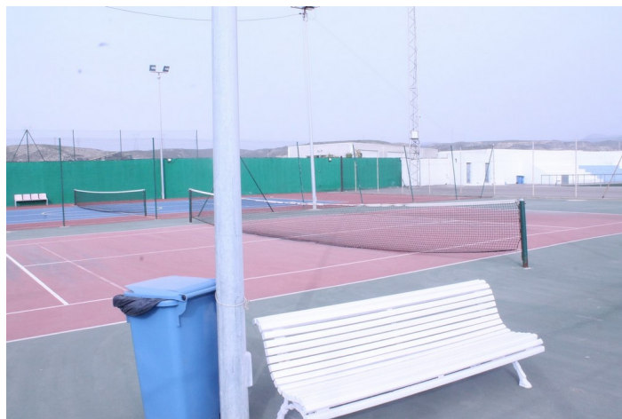
Pistas de tenis