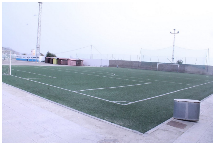
Pista de fútbol