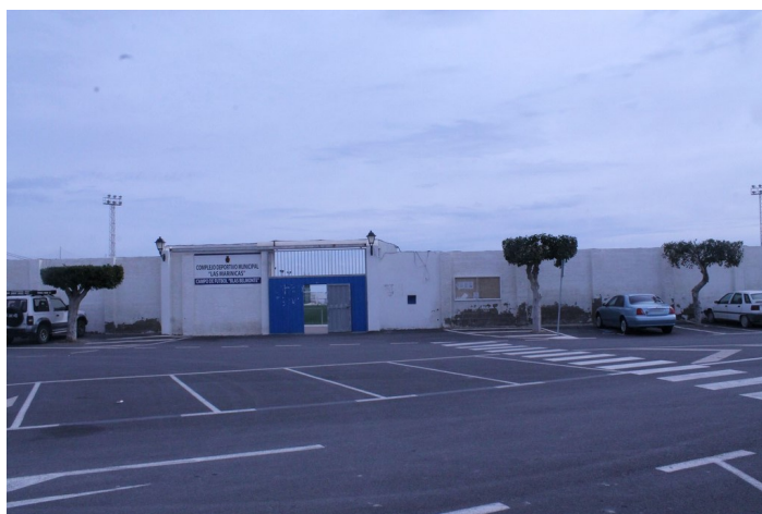
Entrada a C.D.M. Las Marinicas