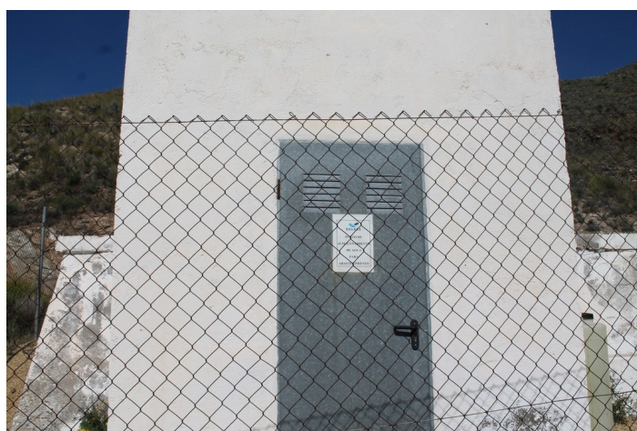
Puerta de entrada al depósito de agua Cueva del Pájaro