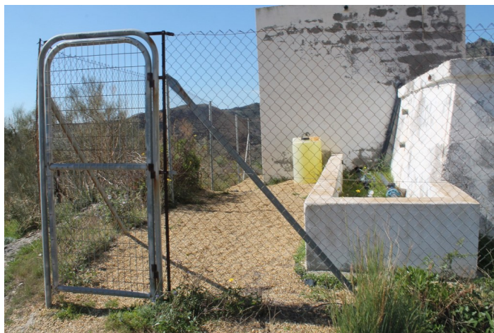
Acceso al depósito de agua Cueva del Pájaro