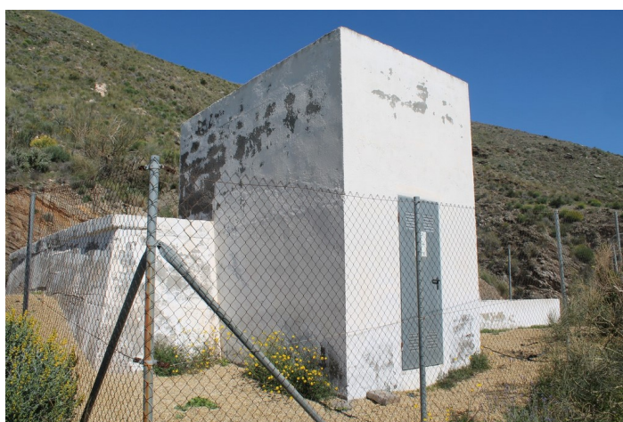
Depósito de agua Cueva del Pájaro desde la izquierda