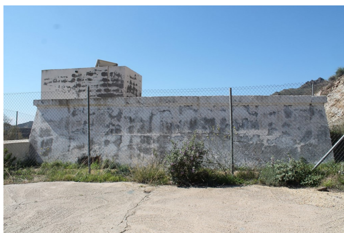
Dep sito de agua Cueva del P ijaro desde la derecha