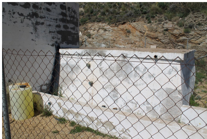
Detalle del dep sito de agua Cueva del P ijaro