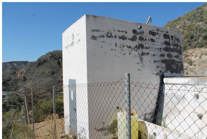
Dep sito de agua Cueva del P ijaro desde la derecha