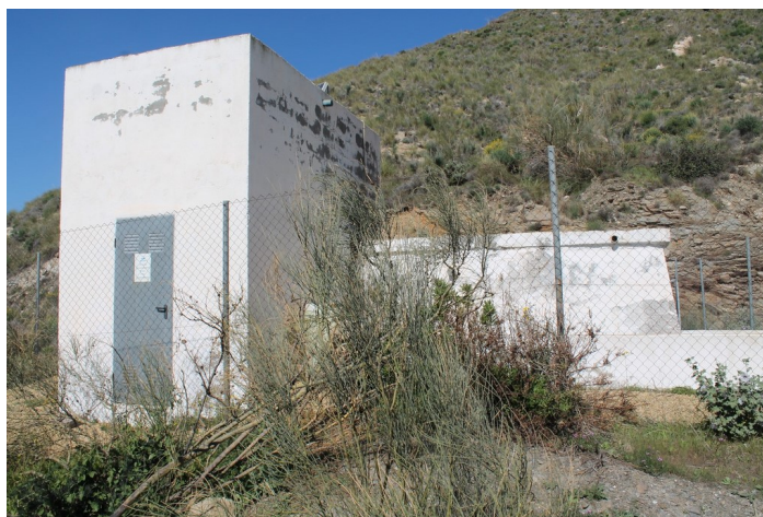
Depósito de agua Cueva del Pájaro