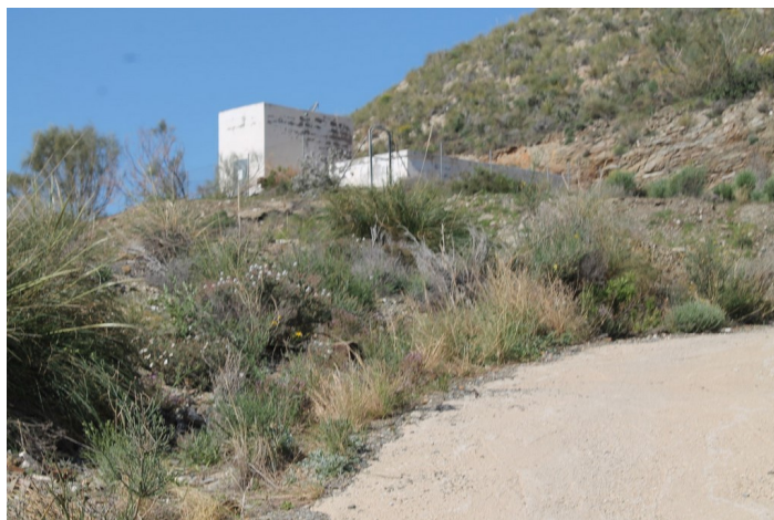
Depósito de agua Cueva del Pájaro desde el camino