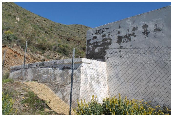
Detalle del depósito de agua Cueva del Pájaro