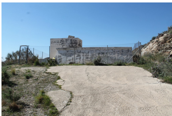
Depósito de agua Cueva del Pájaro desde lejos