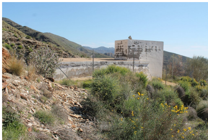
Depósito de agua Cueva del Pájaro desde la izquierda