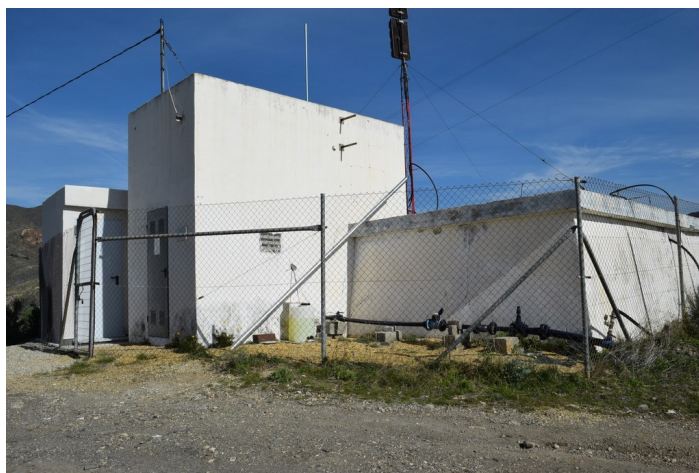
Caseta y Dep 3 sito Saltador Bajo desde la derecha