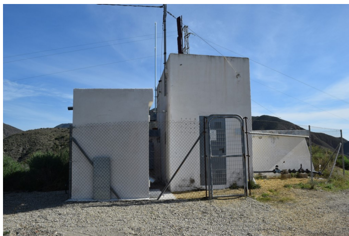
Caseta y Dep 3 sito Saltador Bajo