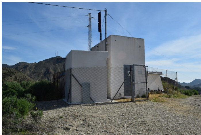
Caseta y Depósito Saltador Bajo desde la izquierda