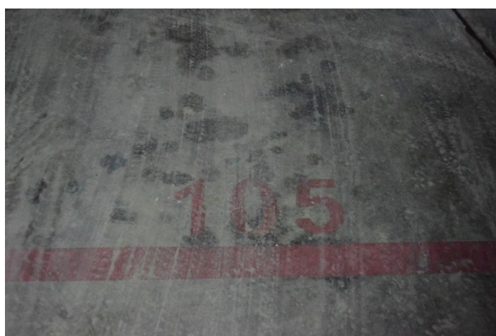
Plaza de Garaje G-105