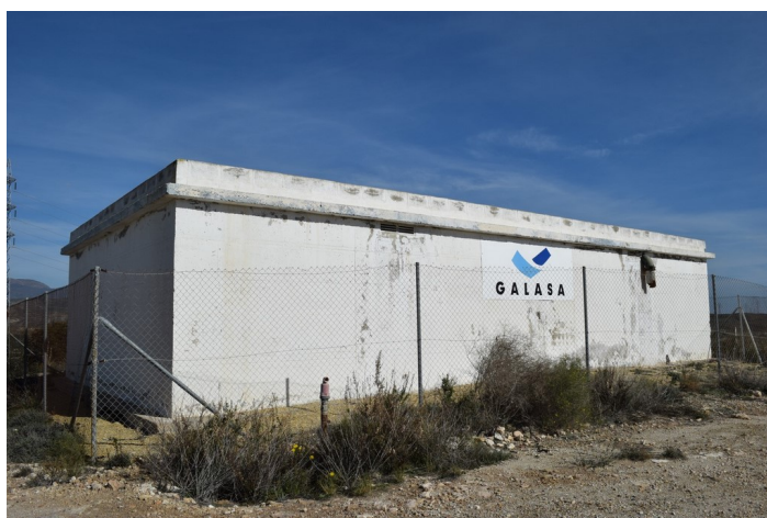
Trasera del depósito de Agua en Paraje Palmerosa