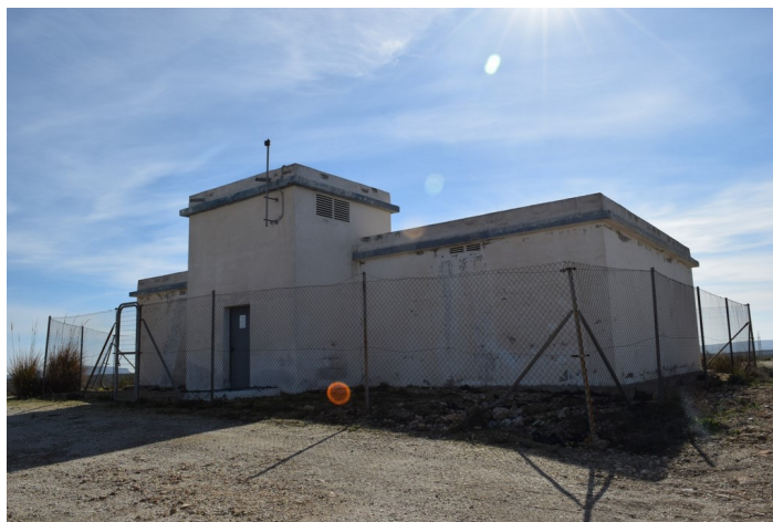
Depósito de Agua en Paraje Palmerosa desde la derecha