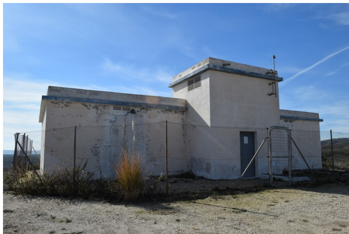
Depósito de Agua en Paraje Palmerosa desde la izquierda