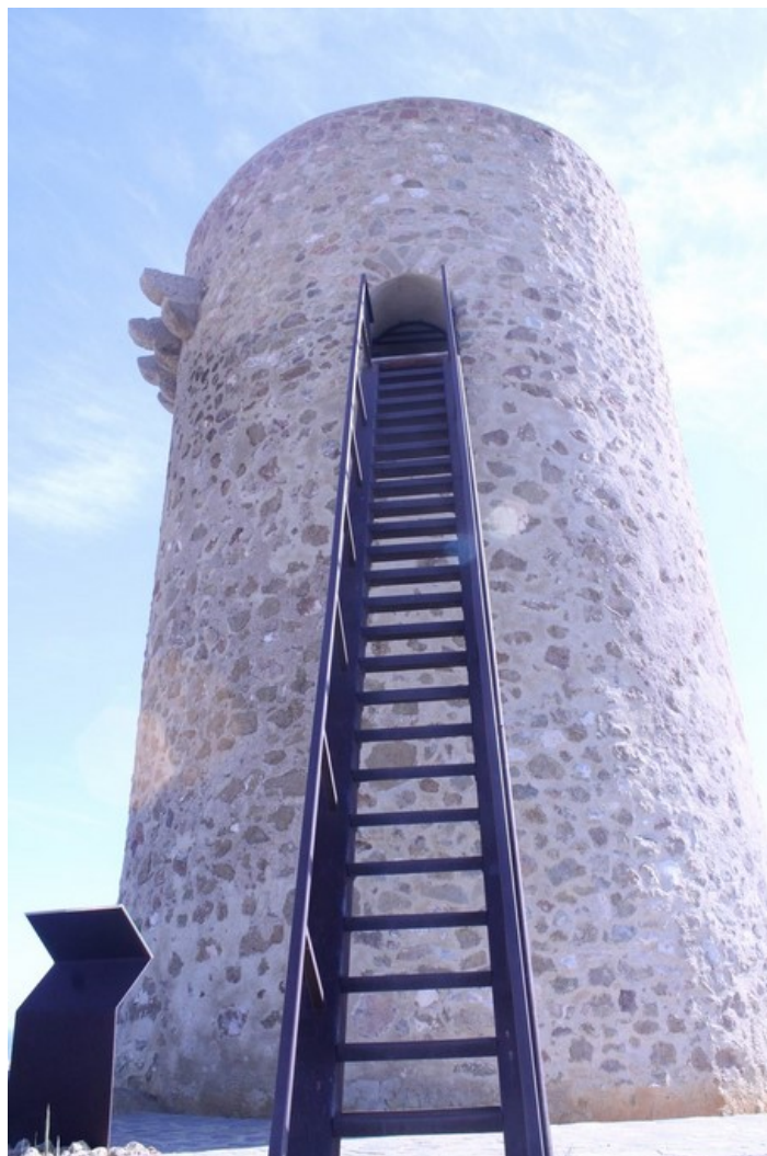
Escaleras de acceso a la Torre del Rayo