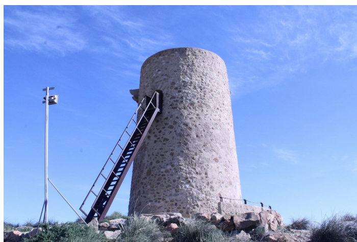
Torre del Rayo desde la derecha