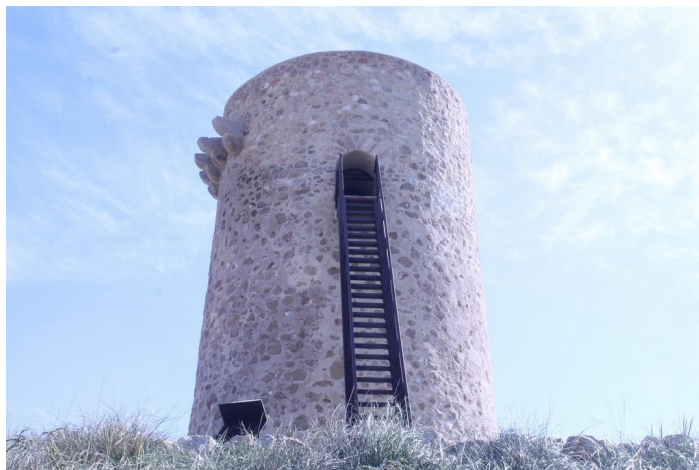
Torre del Rayo