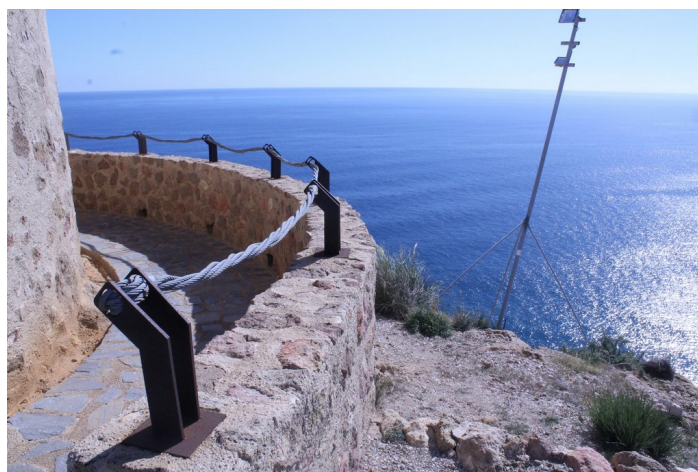
Mirador de la Torre del Rayo