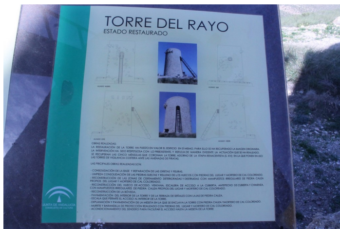
Información de la rehabilitación de la Torre del Rayo