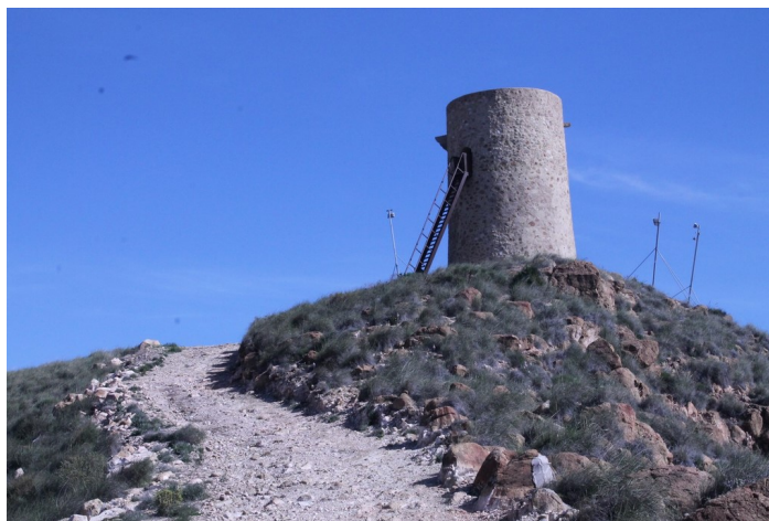
Torre del Rayo desde lejos