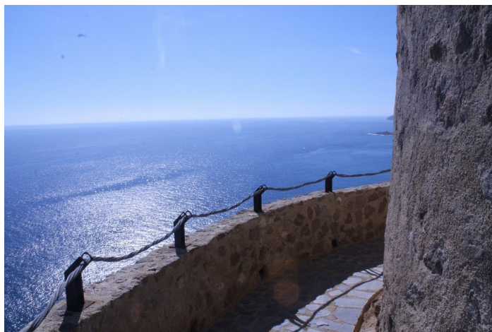
Mirador de la Torre del Rayo