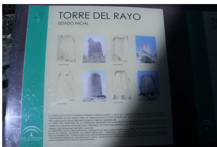
Información de la rehabilitación de la Torre del Rayo