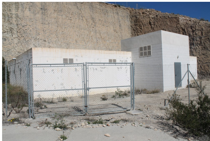
Depósito de agua SI-2 desde la izquierda