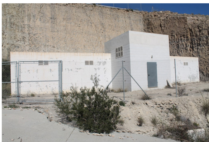
Depósito de agua SI-2 desde la izquierda