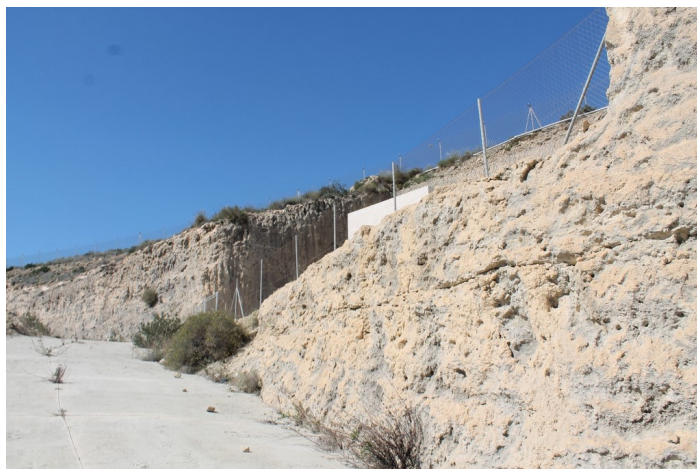
Depósito de agua SI-2 desde la derecha