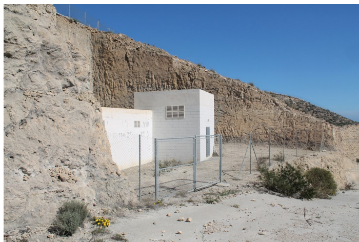
Depósito de agua SI-2 desde lejos