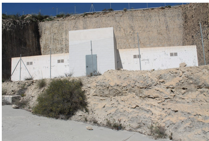
Depósito de agua SI-2