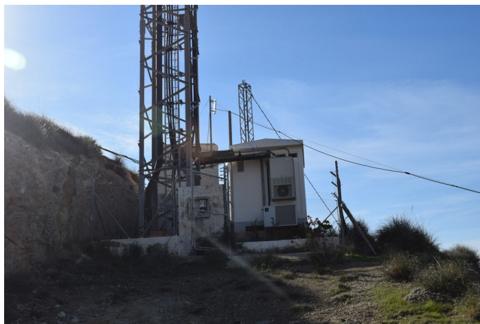
Caseta Repetidor La Islica