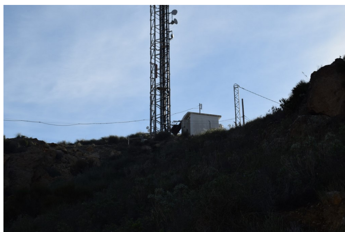
Repetidor La Islica