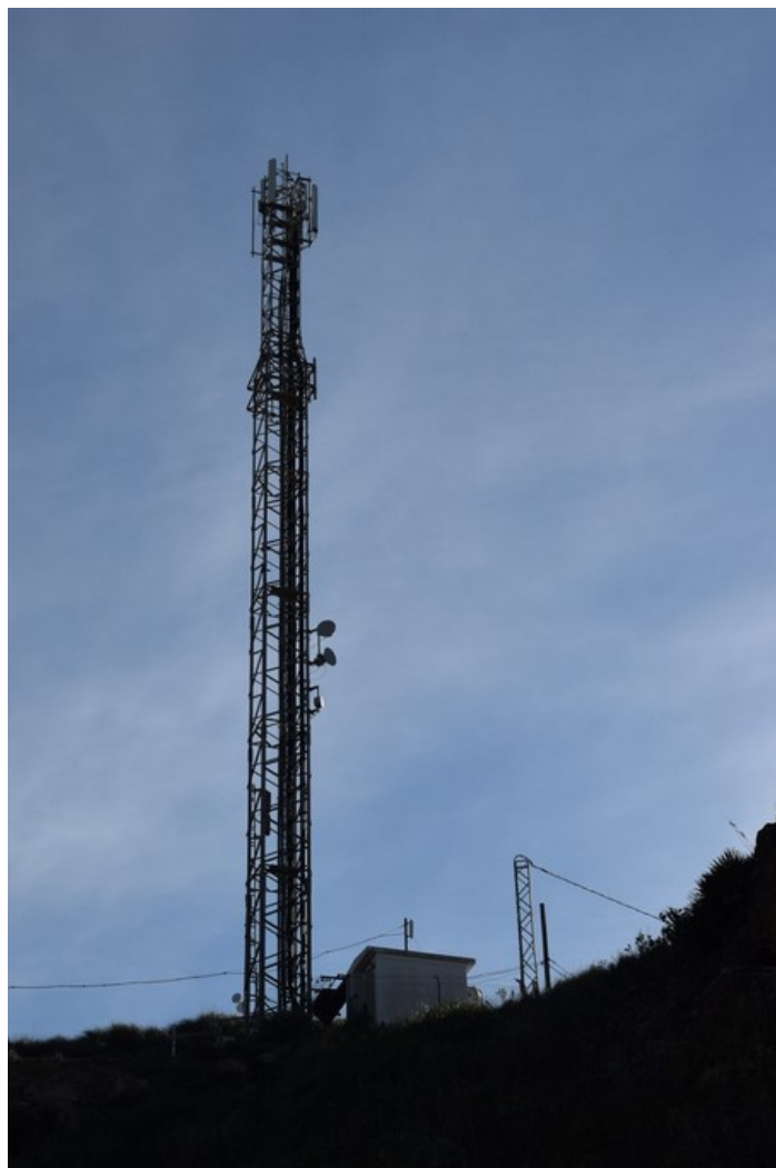
Repetidor La Islica