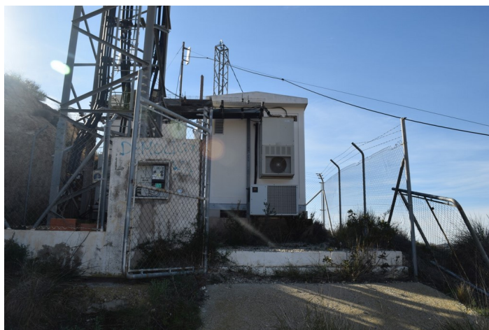
Caseta Repetidor La Islica