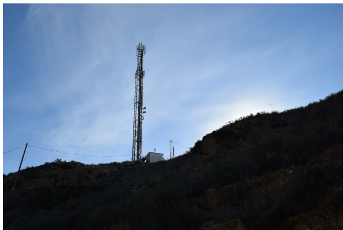
Caseta Repetidor La Islica desde lejos