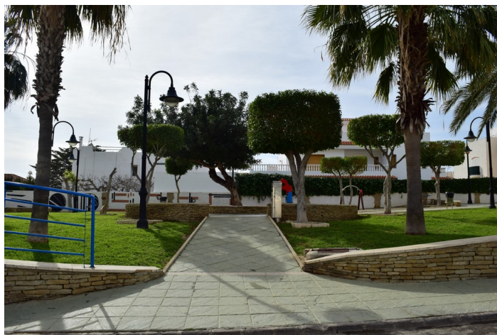
Jesús Rafael Soto 4