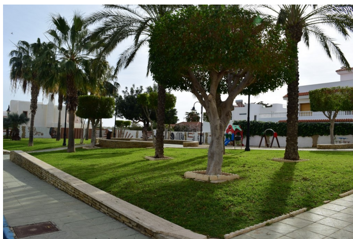
Jes s Rafael Soto 1