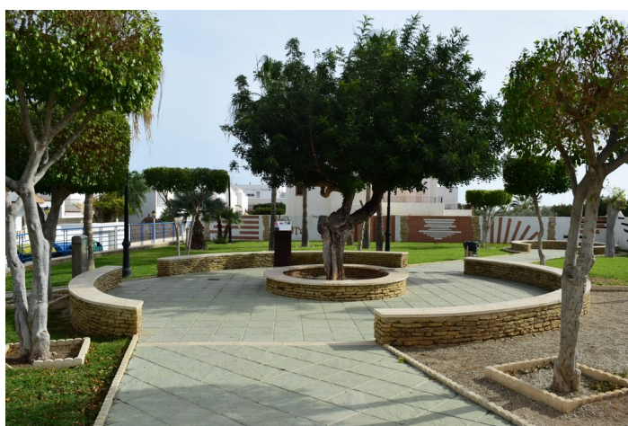
Jesús Rafael Soto 6