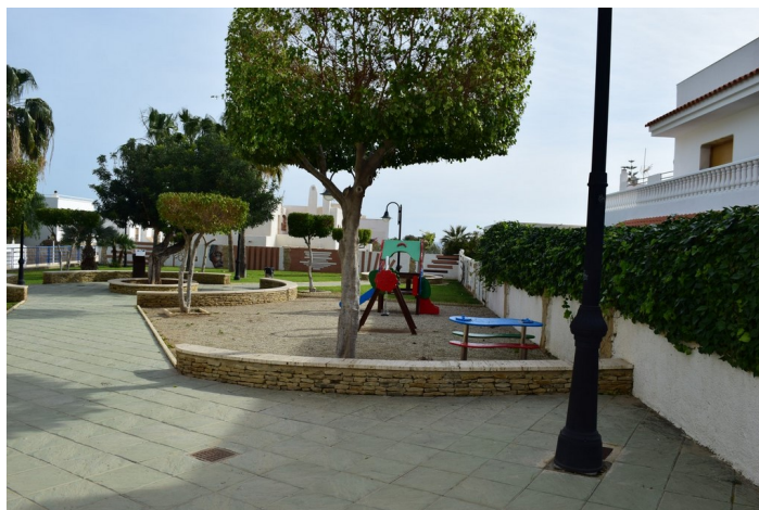
Jesús Rafael Soto 5