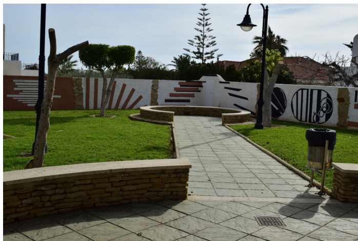
Jesús Rafael Soto 8