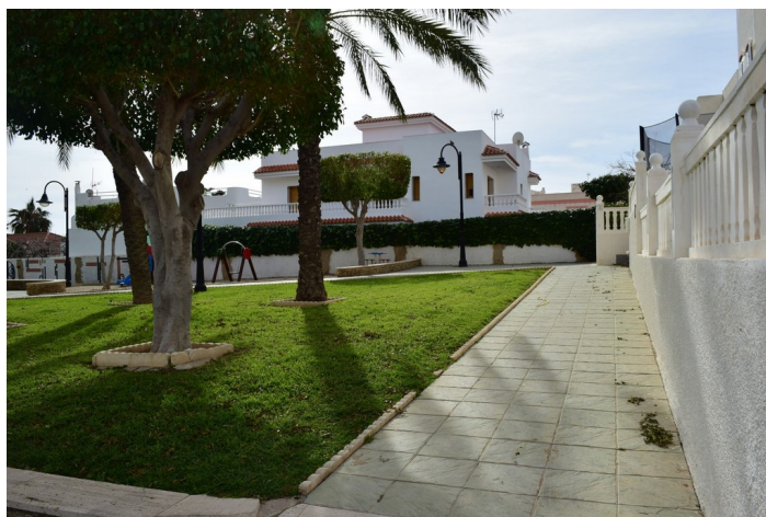
Jes s Rafael Soto 3 Ep grafe 1. Inmuebles