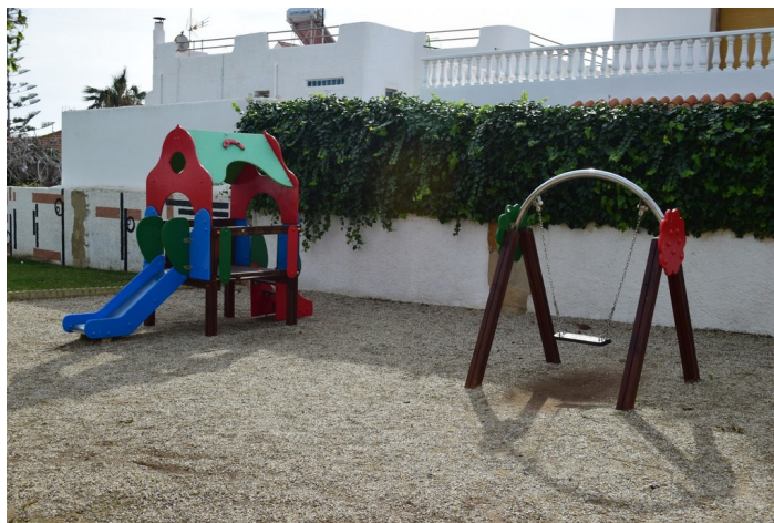
Jesús Rafael Soto 7