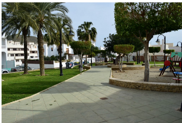
Jes s Rafael Soto 2