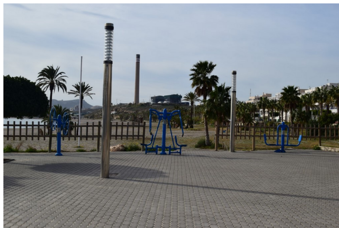
Solar para futuro Skatepark