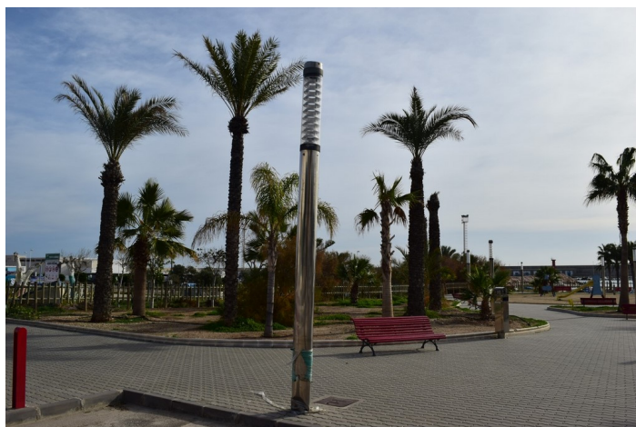
Acceso futuro Skatepark Epígrafe 1. Inmuebles