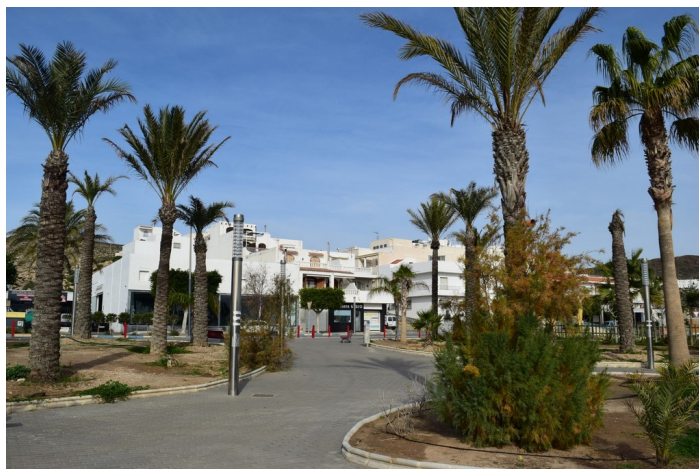
Parque puerto pesquero 11