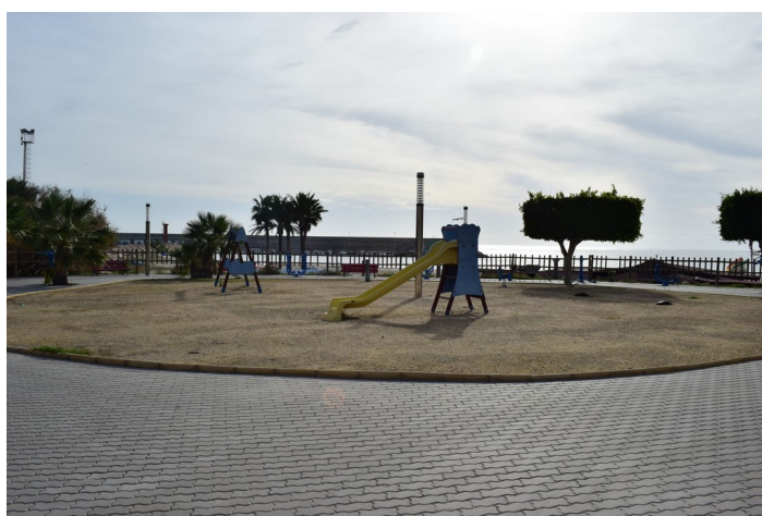
Solar para futuro Skatepark