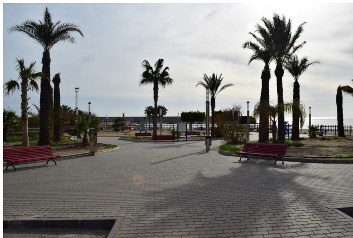
Acceso futuro Skatepark