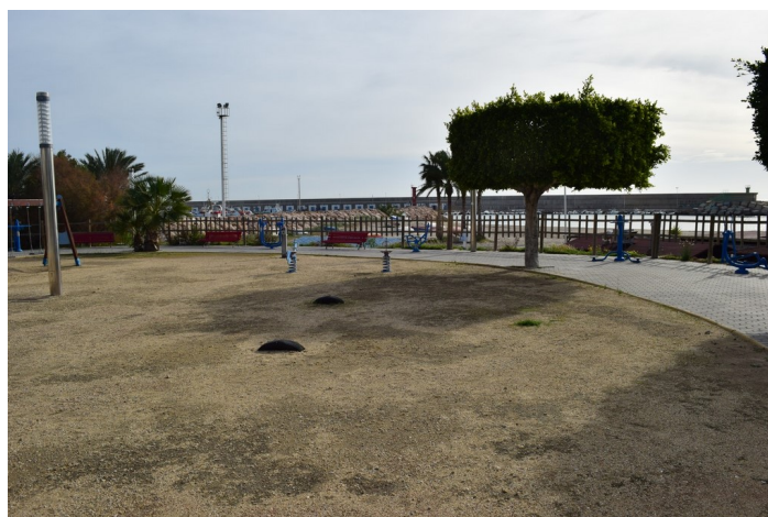
Solar para futuro Skatepark