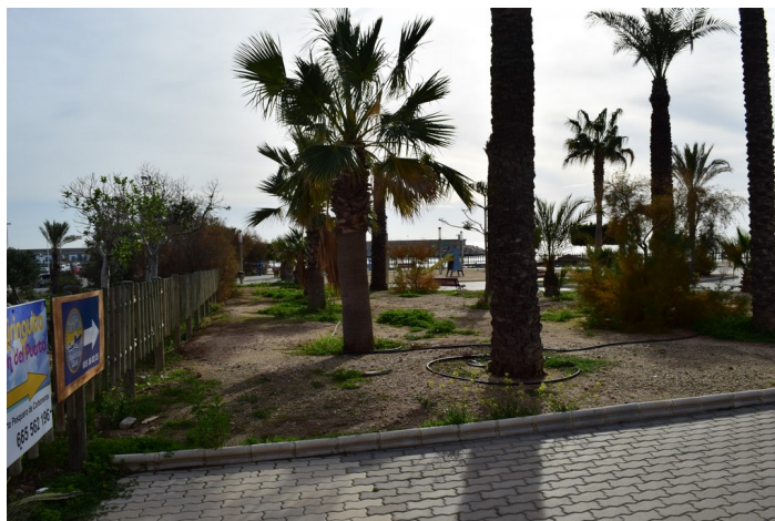
Solar para futuro Skatepark