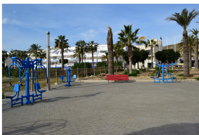
Parque puerto pesquero 10