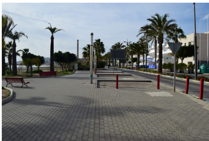
Acceso futuro Skatepark