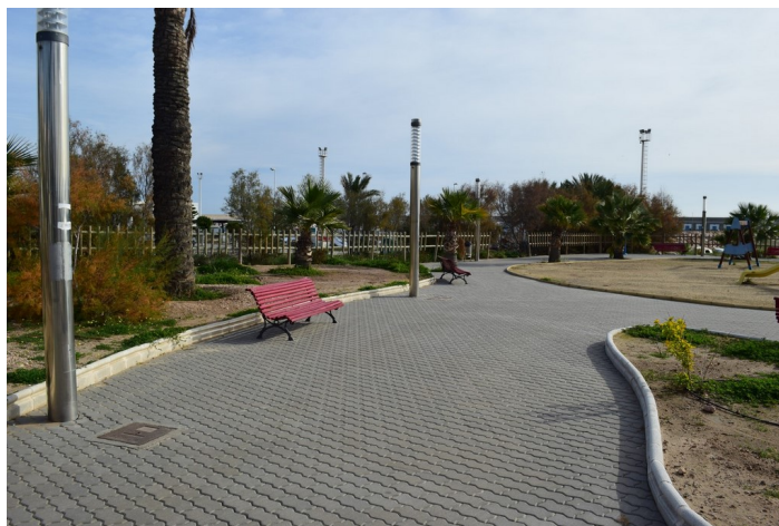
Solar para futuro Skatepark