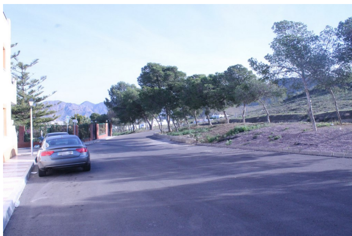
Espacio libre (El Llano) 3 Epígrafe 1. Inmuebles