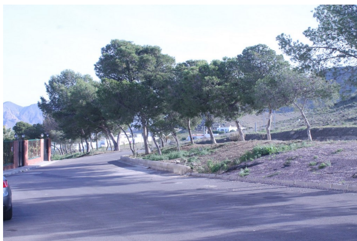
Espacio libre (El Llano) 2