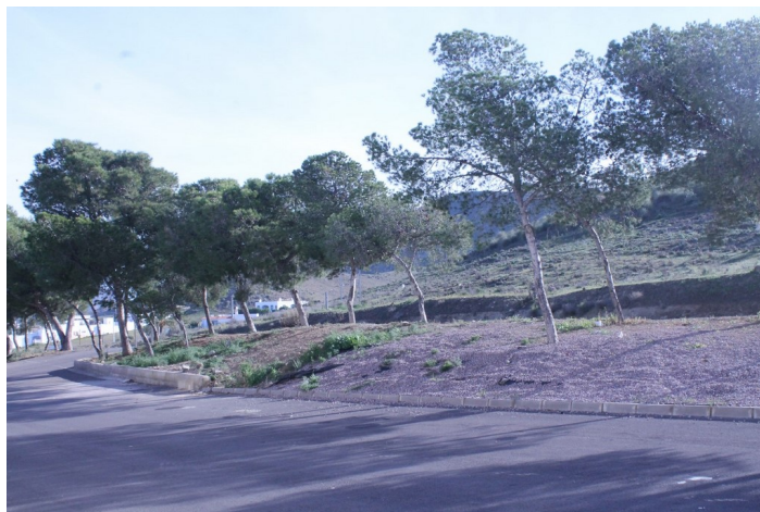
Espacio libre (El Llano) 1