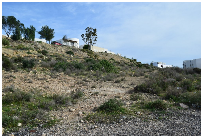
Calle sin nombre 2 UA-11