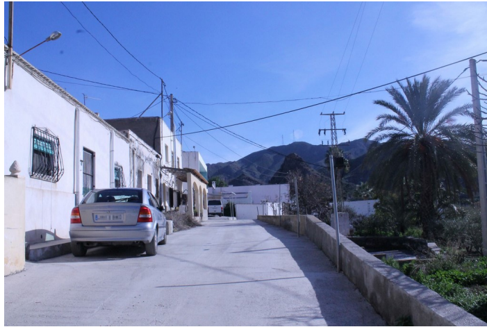
Subida a la Barriada Saltador Bajo