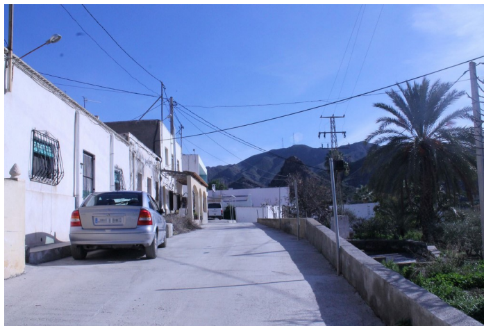
Subida a la Barriada Saltador Bajo