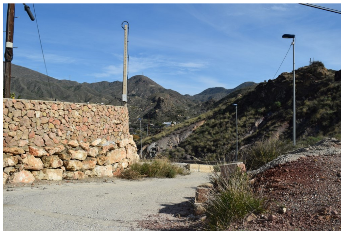
Llegada a la Barriada Saltador Bajo