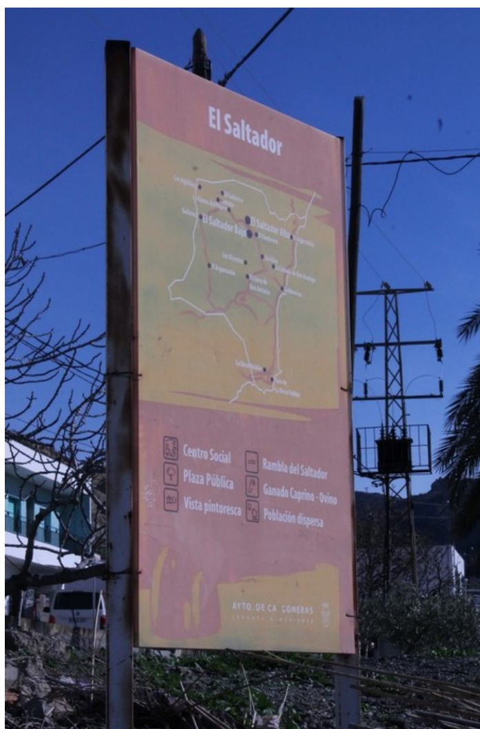
Plano de la Barriada Saltador Bajo