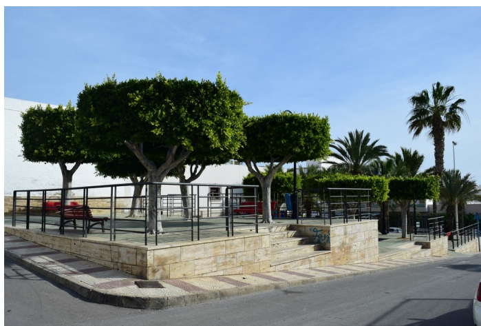
Julio Lepark 1