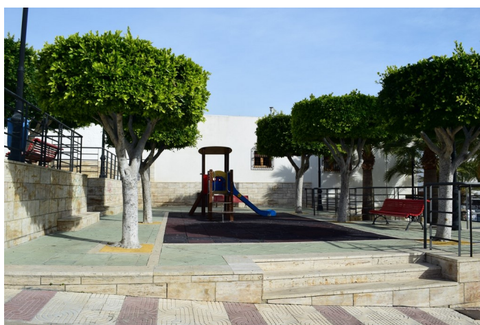
Julio Lepark 5