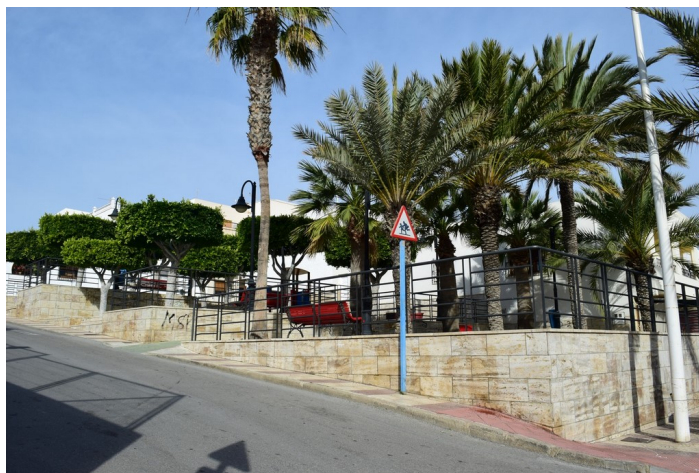
Julio Lepark 2