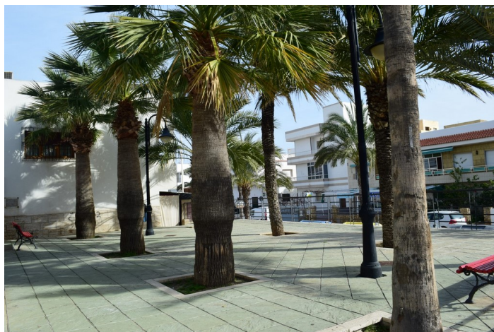
Julio Lepark 4