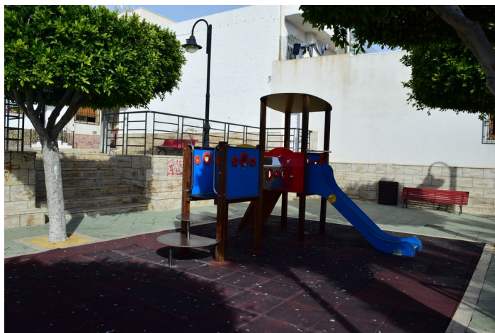
Julio Leparck 7