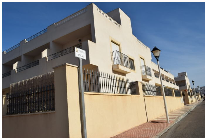
Entrada a Calle Rosal