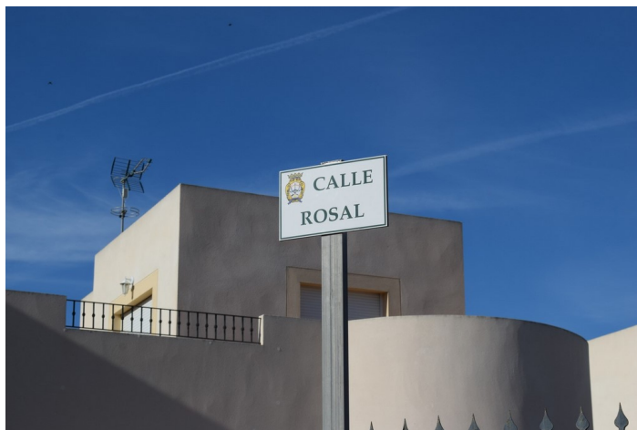
Placa Calle Rosal